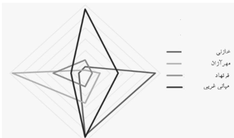
نمودار ۲- میزان موفقیت طرح‌ها در تامین چهار مولفه مورد بررسی

برای سایر نواحی برنامه ریزی در شهر مشهد و یا شهرهای مشابه، به انجام برسد. به هر حال این تحقیق به عنوان معدود تحقیقات انجام شده در ارتباط با کارآیی طرح‌های شهری و ضرورت انتخاب طرح‌های متناسب با شرایط محلی و منطقه ای هر قلمروی خاص، می‌تواند پاسخگوی برخی از ابهامات مطرح در این ارتباط باشد.