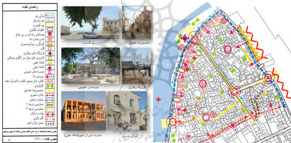
تصویر ۱: نمونه‌ای از تحلیل صورت گرفته در محلات بافت تاریخی (نگارندگان)

فوق‌الذکر، به تحلیل نظام بصری محلات بافت تاریخی اقدام کرده‌اند. سپس در نهایت معیارها و شاخص‌ها در قالب ماتریس ارزیابی موردنظر تدقیق شده و این معیارها و شاخص‌ها نسبت به یکدیگر و همچنین در هر محله بررسی و با وزن‌دهی شاخص‌ها نسبت به یکدیگر سنجیده و ترازایی گردیده‌اند. تصویر شماره ۱، مبین نظام بصری و آرایه‌های آن در محلات بافت تاریخی هستند. پس از بررسی‌های میدانی (مشاهده و پرسشنامه) و تحلیل محدوده مطالعاتی براساس معیارها و شاخص‌های منتج از مرور ادبیات موضوع، به مجموعه‌ای از شاخص‌های نهایی دست‌یافته شده است تا بتوان محلات بافت تاریخی را بدین‌وسیله مورد سنجش و ارزیابی قرار داد. لذا در ادامه نمونه‌ای از شاخص‌های تدقیق‌شده جهت سنجش محدوده مطالعاتی با ضریب اهمیت آرایه‌ها براساس بررسی‌های میدانی ارائه شده است (ر.ک به جدول شماره ۶).