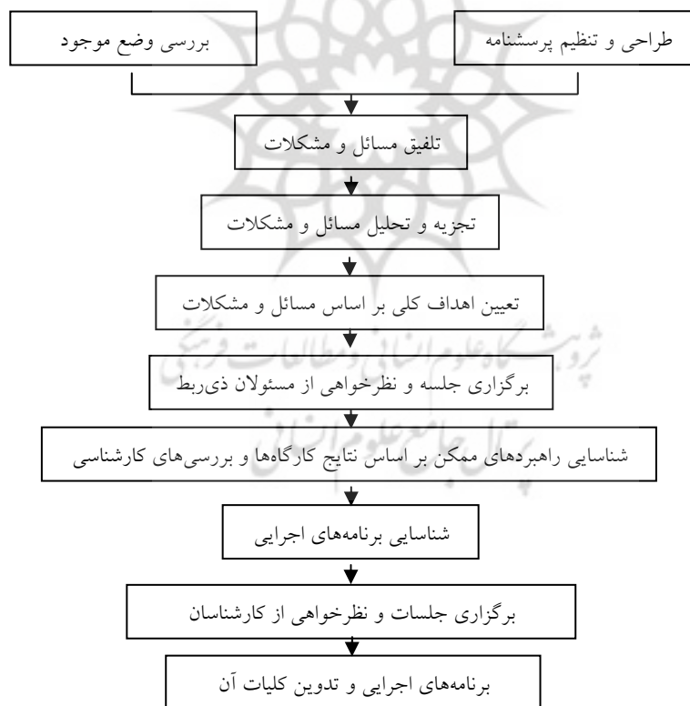
شکل ۱- چارچوب نهایی تدوین «برنامه پنج‌ساله توسعه روستایی» روستای صدرآباد

نهایی عوامل داخلی و خارجی و تشکیل ماتریس IE مهم‌ترین راهبرد مؤثر در توسعه روستا و تدوین برنامه پنج‌ساله مشخص شد. تدوین راهبردها از طریق شیوه سوات و با استفاده از نظرات کارشناسان و خبرگان حاصل شده است. این شیوه یکی از ابزارهای راهبردی برای تطابق نقاط قوت و ضعف درونی نظام با فرصت‌ها و تهدیدهای بیرونی آن است. به‌طور کلی، فرآیند تدوین «برنامه پنج‌ساله توسعه روستایی» روستای صدرآباد در شکل ۱ ارائه شده است.