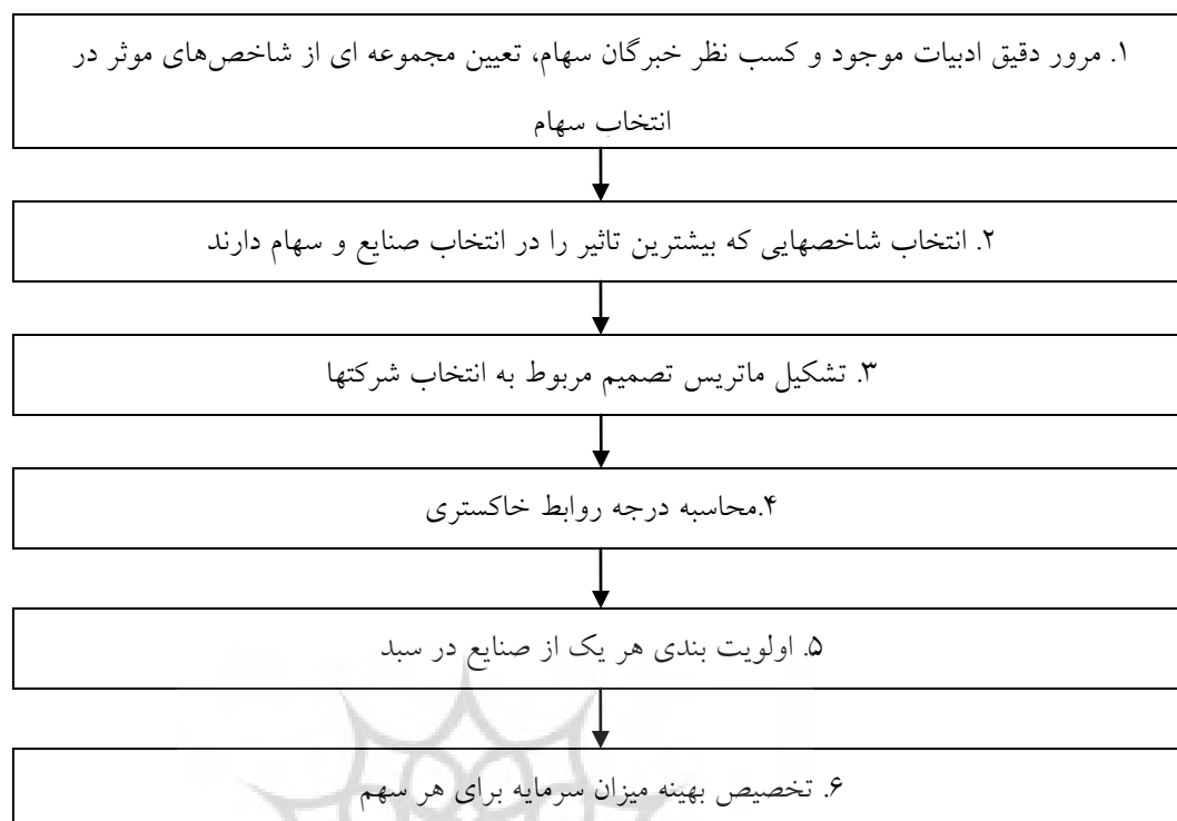
شکل ۲. مراحل اجرای تحقیق

شاخص هایی که برای ارزیابی انتخاب سهام در نظر گرفته شد، ۱۹ مورد است که بر اساس نظر خبرگان و کارشناسان ارشد مالی و اساتید دانشگاه و همچنین فعالان بوس جمع آوری شده بود. جدول ۱ اوزان شاخص ها را که با استفاده از پرسشنامه مقایسات زوجی بدست آمده است نشان می دهد.