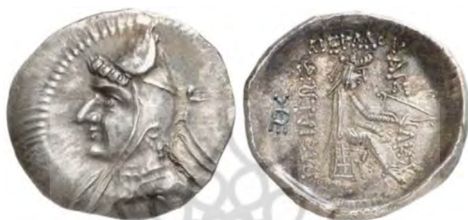
شکل 1 یک درهمی نوع مهرداد اول از ضربخانه اکباتان (S14. 10)

فعالیت ضربخانه هگمتانه از اواخر دوران حکومت مهرداد اول آغاز شده و تا پایان این امپراتوری همچنان ادامه می‌یابد. اولین گروه از سکه‌های این ضربخانه، یک درهمی‌هایی (S10. 10) و (S 10. 14) است که بلافاصله پس از فتح هگمتانه در سال 148 ق. م ضرب شده‌اند. در این سکه‌ها مهرداد اول با کلاه باشلقی به تصویر کشیده شده است؛ درحقیقت، این سکه‌ها آخرین سری از سکه‌های کلاه باشلقی اشکانی هستند. (تصویر 1) (غلامی، 1392: 57)