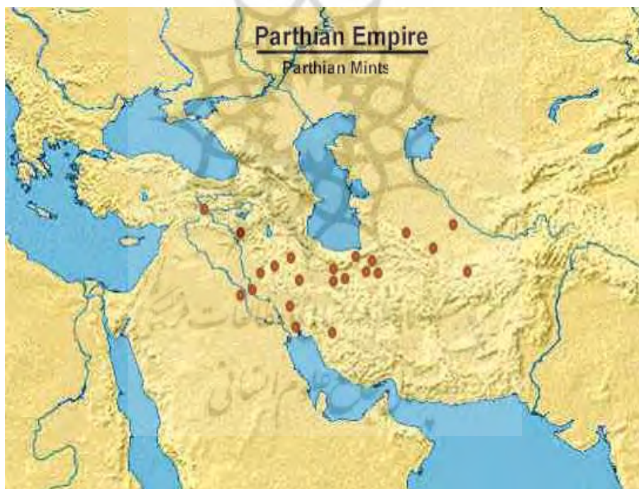
نقشه 1 ضرابخانه‌های اشکانی (sellwood, 1980)

ضرابخانه نیسا، میتادات کرت، هگمتانه (کباتان)، شوش، سلوکیه، رگا (ری)، سیرینک، مارژیان (مرو)، تراکزیان، خاراکس، تیسفون، آریا (هرات)، هراکلیه، تمبراکس، فیلاس، ضرابخانه درباری، کنکوبار (کنگاور)، آپامنا، لائودیسه (نهایند). (ملکزاده بیانی، 1353: 21) (نقشه 1) در این میان، ضرابخانه هگمتانه (ضرابخانه سلطنتی) از جایگاه ویژه‌ای برخوردار بوده است.