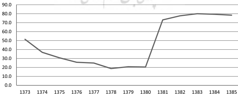
نمودار ۲- درجه باز بودن بخش صنعت در سال‌های ۸۵-۱۳۷۳ (درصد)

با توجه به جدول (۲) ملاحظه می‌شود که روند تغییرات سه شاخص آزادسازی تجاری و سهم اشتغال زنان هم جهت بوده است، یعنی در دوره ۱۳۷۳-۱۳۸۵، همراه با افزایش درجه باز بودن اقتصاد در خصوص کالاهای صنعتی، سهم اشتغال زنان افزایش یافته است. نمودار (۲) درجه باز بودن بخش صنعت را نشان می‌دهد. همان‌طور که در نمودارهای (۱) و (۲) دیده می‌شود، همبستگی مثبتی میان سهم اشتغال زنان و درجه باز بودن بخش صنعت وجود دارد. بنابراین، با آزادسازی تجاری، شاخص‌های آزادسازی تجاری افزایش یافته و به نظر می‌رسد به دنبال آن سهم اشتغال زنان نیز افزایش یابد. در واقع آزادسازی تجاری پنجره فرصتی برای اشتغال زنان است. برای آزمون دقیق فرضیه مذکور در قسمت‌های بعد پس از برآورد مدل‌های اقتصادسنجی به بررسی آن خواهیم پرداخت.