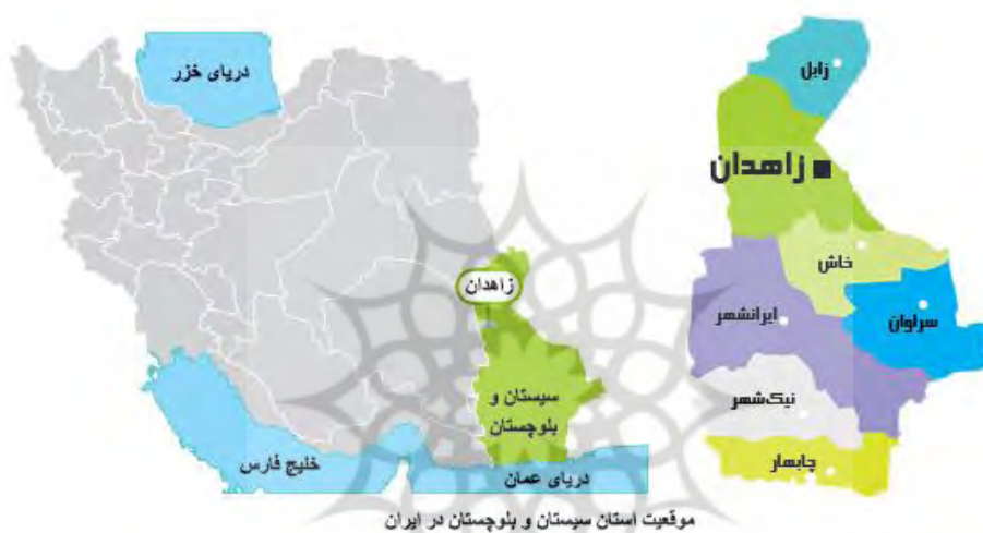
نقشه ۱- موقعیت شهر زاهدان در شهرستان زاهدان، استان سیستان و بلوچستان و ایران