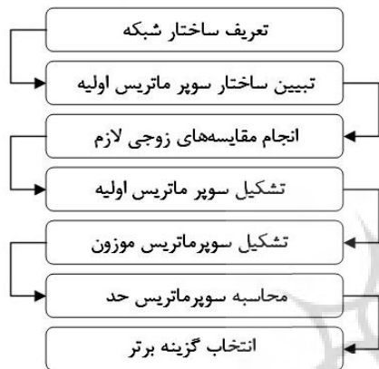
شکل 3- مراحل اجرای ANP Figure 3- Steps of ANP

معادل بامعیارها یا گزینه‌ها می‌باشند و شاخه‌هایی که این گره‌ها را به هم متصل می‌کنند نیز معادل با درجه وابستگی آن‌ها به همدیگر می‌باشند. تعیین روابط موجود در ساختار شبکه‌ای یا تعیین درجه وابستگی‌های متقابل بین معیارها باهم و گزینه‌ها، مهم‌ترین کار روش تحلیل شبکه است. ارتباط و وابستگی می‌توانند به شکل ارتباط سطوح مختلف شبکه به صورت خارجی یا داخلی باشد. اهمیت نسبی هر عضو از مجموعه (در سطح مربوط به خود) مشابه روش تحلیل سلسله مراتبی به کمک مجموعه‌ای از مقایسه‌های زوجی انجام می‌پذیرد. فرآیند ANP دارای چهار گام اصلی زیر است (24 و 25):