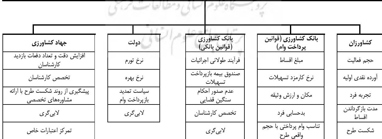
شکل 4- عوامل مؤثر بر تأخیر یا عدم بازپرداخت تسهیلات اعطایی با استفاده از روش دلفی Figure 4- Factors Affecting on nopayment or delay repayment facilities using Delphi