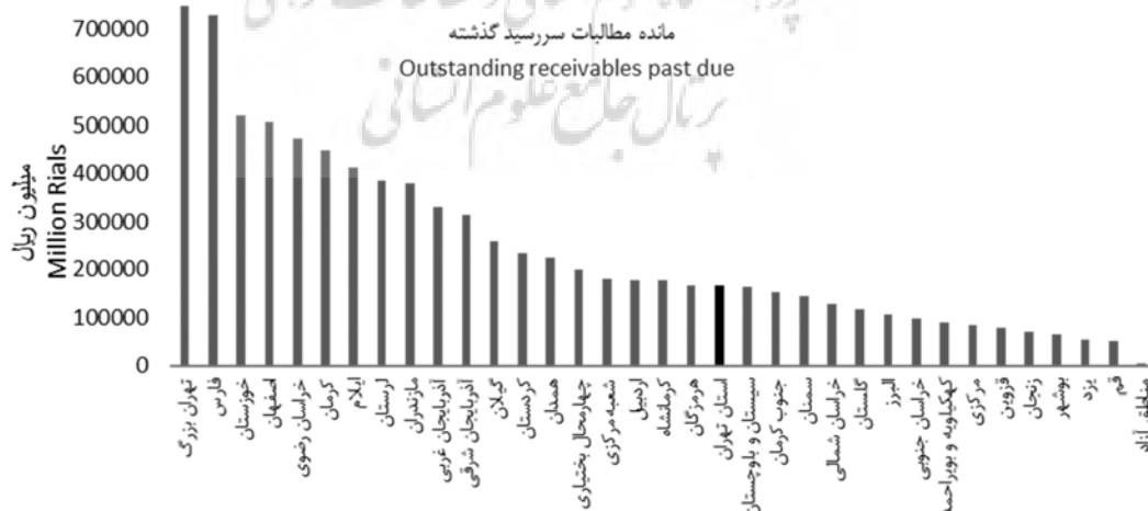
شکل 1- نمودار استانی اصل مانده مطالبات سر رسیده بانک کشاورزی سال 1391 Figure1- The charts of provincial outstanding receivables of Agricultural bank in2012

از نظر اصولی با توجه به سهم بسیار ناچیز پس‌اندازها، قسمت اعظم منابع مالی مؤسسات اعتباری از محل بازپرداخت وام‌های پرداخت شده باید تأمین شود. لذا در اینجا، نقش و اهمیت بازپرداخت اعتبارات در کنار خود اعتبارات بیش‌ازپیش نمایان می‌شود؛ بنابراین، هر مشکلی که بازپرداخت وام‌ها را تهدید کند، مؤسسات اعتباری را در ارائه وام‌های مورد نیاز کشاورزان با مشکل روبرو خواهد کرد (12). تنوع این ریسک‌ها و گاهی شدت آن‌ها به حدی است که اگر نهاد