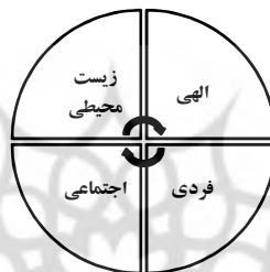
شکل ۱: ابعاد رفتار اخلاقی در سبک زندگی زمینه‌ساز ظهور موعود

اخلاقی را تشکیل می‌دهد. تمام تحولات رشدی که بتدریج در راستای اهداف عالی معرفتی و هماهنگ با اهداف آفرینش در آدمی پدید می‌آید از این چهار جنبه بیرون نیست. در حقیقت تقویت معرفت در حوزه قلمروهای چهارگانه است که آدمی را به سبک زندگی مهدوی هدایت می‌کند و رشد و بالندگی سعادت‌مندان را موجب می‌شود و انسان زندگی دنیا را مقدمه‌ای برای زندگی اخروی و حیات جاوید و حسن مآب قرار می‌دهد و هدف قرب و کمال مطلوب را برای خود فراهم می‌سازد (سجادی، ۱۳۸۸: ۹۱).