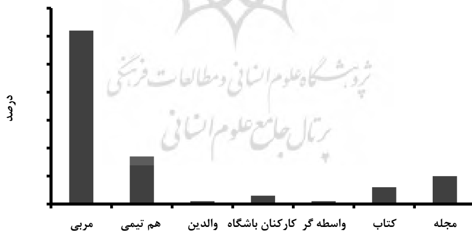
شکل ۱- منابع دریافت اطلاعات در ارتباط با مکملها

منابع دریافت اطلاعات اندام‌پرووران درمورد مکملها در شکل ۱ به نمایش درآمده است. براین اساس، مهم‌ترین منبع دریافت اطلاعات درمورد مکملها، به ترتیب مربیان ۶۲٪/۱، هم‌تیمی‌ها ۱۷٪/۲، مجله‌ها ۱۰٪/۳، کتاب‌ها ۵٪/۷، کارکنان باشگاه‌ها ۳٪/۴، واسطه‌گران ۷۶٪/۰ و والدین ۳۸٪/۰ بیان شده است.