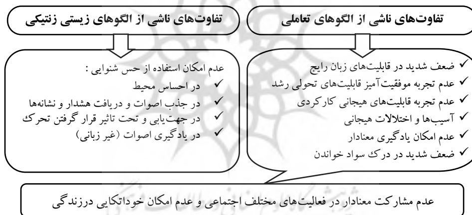
شکل ۲: تفاوت‌های فردی افراد آسیب‌دیده شنوایی با همتایان و همسالان عادی

اگرچه عدم وجود هریک از حواس، انسان را از کسب برخی تجربیات ارزشمند محروم می‌نماید، اما وجود افرادی چون بریدجمن و کلر مؤید این اصل رویکرد (DIR) است که در صورت نقص در حواس، فقط مسیر رشد متفاوت خواهد بود. عدم توجه به تفاوت‌های مسیر رشد موجب ایجاد تفاوت‌هایی بین فرد آ.د.ش با همسالان عادی خواهد شد. تفاوت‌های فردی افراد آسیب‌دیده شنوایی با همتایان و همسالان عادی‌شان در شکل (۲) نشان داده شده است.