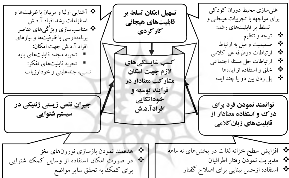
شکل ۴: مواضع هدف‌گیری شده در الگوی پیشنهادی رشد یکپارچه

جامعه هدف موضوعی را پیشنهاد نمودند که در شکل (۴) به تصویر کشیده شده است.