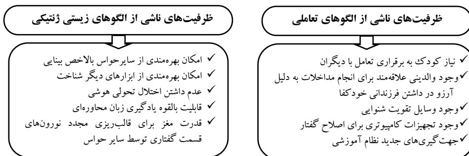
شکل ۳: ظرفیت‌های افراد آسیب‌دیده شنوایی (آ.د.ش)

پژوهشگران در این پژوهش برای تعیین این مسیر با توجه به ظرفیت‌های مشخص شده برای افراد