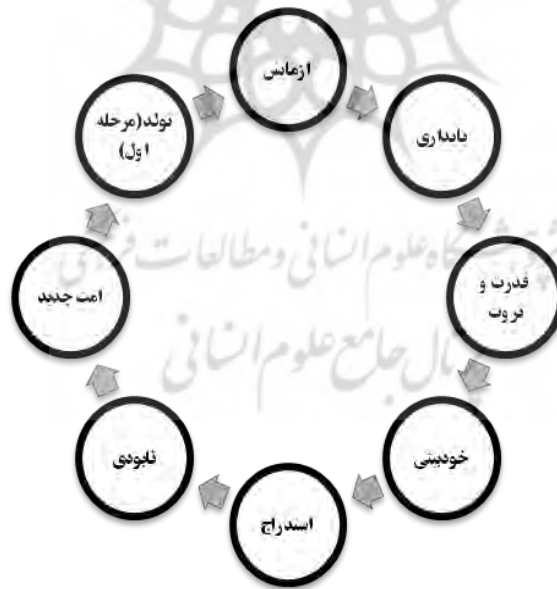
سیر حرکت تمدن طاغوتی

۳. بنابراین اگر ثروت و قدرت امتی را تباه کند، خداوند آنها را به حال خودشان وا می‌گذارد و آنها در تباهی فرو می‌روند (حالت استدراج) و تباهی آن امت را از درون می‌پوساند. به همین علت است که پایان دوره تمدنی تاریخ، سقوط و فروپاشی یکباره و ناگهانی است نه مرگ تدریجی؛ برعکس پیدایش و رشد تمدن‌ها که به صورت تدریجی است. تعبیر قرآن در این زمینه دقیق است: «وَدَمَّرْنَا مَا كَانَ يَصْنَعُ فِرْعَوْنُ وَقَوْمُهُ وَمَا كَانُوا يَعْرِشُونَ» (اعراف: ۱۳۷). یعنی به یکباره ویران کردیم. در واقع سیر حرکت جبهه طاغوت دایره‌ای است که از تولد شروع و به نابودی ختم می‌شود (آصفی، ۱۴۲۴ق، ج ۵، ص ۳۲).