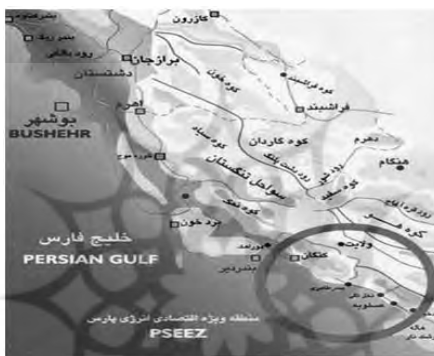
شکل ۱. محدوده منطقه مورد مطالعه

شده است. منطقه پارس جنوبی در شرق استان بوشهر در حاشیه خلیج فارس در ۳۰۰ کیلومتری شرق بندر بوشهر و در ۴۲۰ کیلومتری غرب شهرستان بندر لنگه و در ۵۷۰ کیلومتری غرب بندر عباس واقع است (شکل ۱). در کتاب «اقلیم فارس» از قول مهندس احمد حامی، نام اصلی عسلو و یا عسلویه را «اسل» به معنی آبگیر یا استخر نوشته‌اند و اینکه عسلویه حداقل در ۱۵۰۰ سال اخیر آبادی بوده است تا شهری بزرگ. در روستای عسلویه امروز شماری آب‌انبار وجود دارد که این آب‌انبارها از دید معماری جای بررسی دارند و در امتداد کوه و دریا ایجاد شده و هنوز مورد استفاده قرار می‌گیرند (طاهری، ۱۳۸۸: ۱۷۱-۱۷۰).