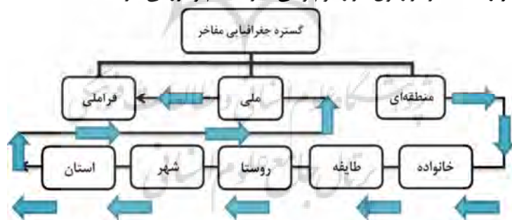
نمودار شماره ۲: جهت گسترش جغرافیایی مفاخر از سطوح خرد به کلان (نگارنده)

گستره جغرافیایی مفاخر را می‌توان در سه عرصه کلی منطقه‌ای، ملی و فراملی تقسیم کرد. مفاخر در هر گستره بر مبنای نظام‌های ارزشی آن گستره قابل شناسایی و بررسی هستند. مفاخر منطقه‌ای می‌تواند از کوچک‌ترین گستره خانواده تا طایفه، روستا، شهر و استان تقسیم و سپس به گستره‌های کلی‌تر مانند ملی و فراملی گسترش یابد؛ برای مثال فردی ممکن است در یک خانواده مایه افتخار باشد اما در گستره شهر فردی معمولی شناخته شود یا اینکه فردی در یک شهر یا استان باعث مباحث و افتخار باشد اما برای مردم سایر مناطق، فردی مانند سایر افراد تلقی شود. این رویکرد را می‌توان به‌صورت ارزش‌گذاری کمی نیز بیان کرد؛ برای مثال می‌توان بر مبنای گستره‌های جغرافیایی و ارزشی مفاخر را به مفاخر تراز اول، تراز دوم و الی آخر تقسیم و بررسی کرد.