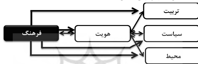
نمودار شماره ۴: عوامل مهم در هویت اجتماعی (نگارنده)

مقوله هویت انسانی که در دوران رشد و تکوین انسان در جامعه شکل می‌گیرد (نمودار ۳)، کاملاً ابعاد اجتماعی داشته و ربطی به خون و نژاد و رنگ پوست و... ندارد (عرفانی، ۱۳۹۰). انسان با رشد و بالندگی از محیط اطراف خود دریافت‌هایی دارد و بر مبنای آنها هویتش شکل می‌گیرد. بروز هویت می‌تواند در عرصه‌های مختلف زندگی فردی و اجتماعی فرد مؤثر افتد؛ بنابراین هویت یکی از مهم‌ترین مؤلفه‌های فرهنگی به حساب می‌آید که عوامل فرهنگ، تربیت، سیاست و محیط نقش قابل توجهی بر آن دارند.