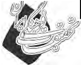
آسیب‌های اجتماعی میانگین از ۵

جدول ۱، نشان‌دهنده وضعیت توسعه گردشگری در شهر همدان است. با توجه به اینکه میانگین به دست آمده (۱۴/۳۷) بیشتر از میانگین مورد انتظار (۱۲/۵) بوده، در نتیجه گردشگری در شهر همدان توسعه یافته است. اختلاف میانگین به دست آمده و مورد انتظار ۱/۸۷ است. سطح معنی داری به دست آمده نیز برابر با (sig= 0/000) است و با ۹۵ درصد اطمینان می‌توان بیان داشت که گردشگری در شهر همدان توسعه یافته است.