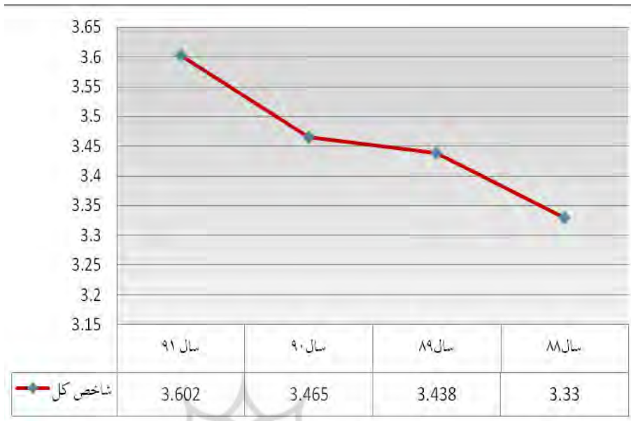
نمودار ۱. روند شاخص کل فرهنگ عمومی در دانشگاه‌ها برای ورودی‌های سال‌های مختلف

در جداول بالا اندازه شاخص کل فرهنگی را به تفکیک می‌بینیم که نشان‌دهنده کاهش گرایش دانشجویان به شاخص‌های منتخب پژوهش و در نتیجه کاهش شاخص کل فرهنگ عمومی دانشجویان در طول چهار سال اول حضور در دانشگاه است.