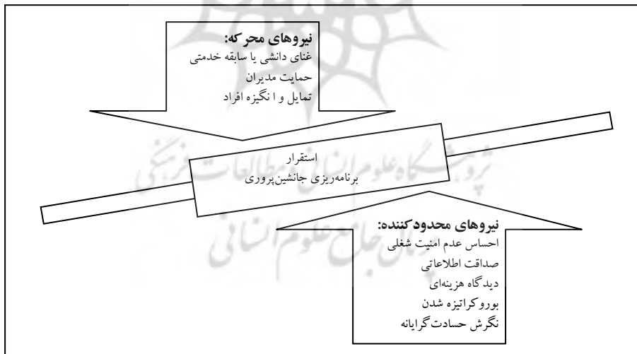
نمودار ۲. تحلیل میدان نیرو در برنامه‌ی جانشین‌پروری

در یک جمع‌بندی، می‌توان به دو سؤال اساسی تحقیق چنین پاسخ داد: در پاسخ به سؤال اول، به معرفی عوامل تسهیل‌کننده در برنامه‌ی جانشین‌پروری و در پاسخ به سؤال دوم، به معرفی عوامل بازدارنده‌ی برنامه‌ی جانشین‌پروری در شرکت ایتوک ایران پرداخته می‌شود.