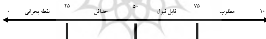
شکل ۲. یوستار مقیاس تفسیر نتایج تحقیق

برای ارزیابی انواع فرهنگ، مؤلفه‌ها و گویه‌های تحقیق، مقیاس تفسیر نتایج که در مطالعات مشابه نیز مورد استفاده قرار گرفته و به تأیید اهل فن رسیده بود به کار گرفته شده است. (نمره‌ی میانگین بین ۰ تا ۲۵ نقطه‌ی بحرانی، ۲۶ تا ۵۰ حداقل، ۵۱ تا ۷۵ قابل قبول و ۷۶ تا ۱۰۰ مطلوب می‌باشد).