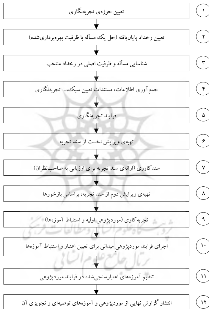
شکل ۳. فرایند موردپژوهی پیمایشی

آموزه‌ها، می‌توانند به شکل‌های گوناگون منتشر شوند و در اختیار همگان قرار گیرند و به‌عنوان گزاره‌های ابطال‌پذیر تا زمانی که به‌طور کلی از اعتبار نیفتاده‌اند مورد بهره‌برداری و کاربری واقع شوند. این فرایند در شکل (۳) نشان داده شده است: