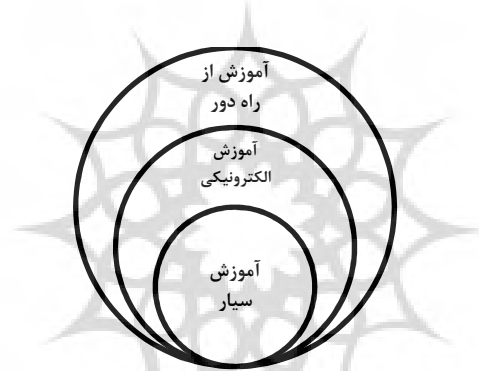
شکل ۲- موقعیت آموزش سیار به عنوان جزئی از آموزش از راه دور و آموزش الکترونیکی

پس از ارائه آموزش از راه دور که آموزشی مبتنی بر متن را از طریق مکاتبات نوشتاری ارائه می‌نمود، آموزش الکترونیکی پا به عرصه نهاد که مجموعه‌ای وسیع از فرایندهای آموزشی را نظیر: آموزش مبتنی بر کامپیوتر، آموزش مبتنی بر وب (WBT)، کلاس‌های مجازی، همکاری‌های دیجیتالی و ... را پوشش داده و محتوای آموزشی را از طریق رسانه‌های گوناگون الکترونیکی شامل: اینترنت ۱ ، اینترانت ۲ ، اکسترانت ۳ ، ماهواره‌ها، نوارهای ویدئویی و صوتی، لوح‌های فشرده و غیره در اختیار افراد قرار می‌دهد. اما پیشرفت تکنولوژی در عرصه آموزشی به این جا محدود نشد، به‌طوریکه امروزه شاهد پا به عرصه نهادن نسلی دیگر از آموزش با نام آموزش سیار هستیم، که آموزش را از طریق ابزارهای الکترونیکی همراه در اختیار افراد قرار می‌دهد و همان‌طور که در شکل (۲) نیز مشاهده می‌شود، می‌توان آموزش سیار را ترکیبی از دو شکل آموزش موجود، یعنی آموزش از راه دور و آموزش الکترونیک دانست (Georgiev et al., 2004). چرا که در این آموزش نیز همانند آموزش از راه دور، جدایی و فاصله میان اساتید و دانش‌پژوهان وجود دارد و از طرفی دیگر همانند آموزش الکترونیک نیز آموزش را از طریق تکنولوژی‌های کامپیوتری، اما این بار با استفاده از ابزارهای الکترونیکی همراه و با تکنولوژی‌هایی پیشرفته‌تر ارائه می‌نماید.