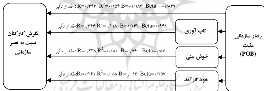
شکل ۲- مدل حاکم بر استاندارد خراسان رضوی

با نگاه به نتایج آزمون فرضیه‌ها (تأیید فرضیه اصلی و سه فرضیه فرعی و رد یک فرضیه فرعی) و همچنین نتایج به دست آمده از تجزیه و تحلیل رگرسیون چندگانه، ضرایب تعیین، همبستگی و... می‌توان مدل حاکم بر استاندارد خراسان رضوی در مورد چگونگی تأثیرگذاری رفتار سازمانی مثبت بر نگرش کارکنان نسبت به تغییر سازمانی را مطابق شکل (۲) ارائه نمود.