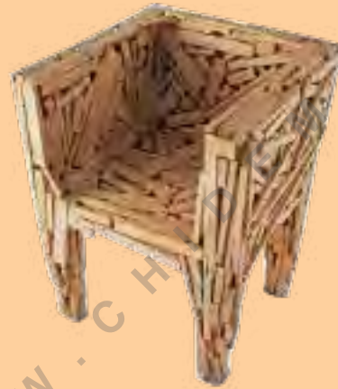
تصویر شماره ۸: طراح: فرناندو و هامبرتو کامپانا

و توجه بسیار زیادی با وجود محدودیت ها و فشارهای تحمیل شده سرهم شده اند و در کنار هم قرار گرفته اند. ادرا ، اسپا ، ایتالیا این صندلی فاوول را تولید می کند.