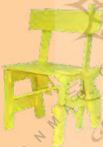
تصویر شماره ۷: طراح: مارتن باس

کلکسیون مبلمان‌های با ارزش مصالح دور ریختنی MDF از یک کارخانه مبلمان را به کار می‌گیرد. محدودیت‌هایی که در این دور ریختنی‌ها وجود دارد بر زیبایی مبلمان تأثیر بسیار مستقیمی دارد و یک ظاهر بی‌ریا و صادقانه برای آن به وجود می‌آورد.