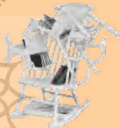
تصویر شماره ۳: طراح: مارتین باس، www.maartenbaas.com