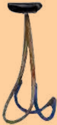
تصویر شماره ۱۲: آچیلی بیسکیلتا (۲۰۰۶)، طراح: مارتینو گمپر، کلکسیون GamperMartino . Abake