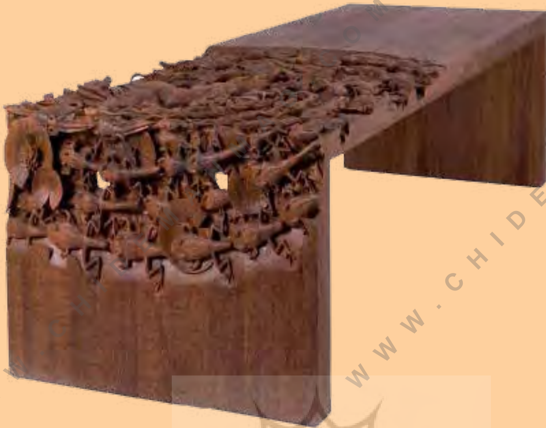
تصویر شماره ۱۱: میز گاداگان، طراح: نیلسون اجیک و میریام ون در لوبه برای دراگ

ملاحظه قرار بگیرد زیرا که هرگونه انقباض و جمع‌شدگی می‌تواند برای یک محصول نهایی بسیار زیان بار باشد. تخته چند لایه کارخانه‌ای از تعداد زیادی لایه‌های چوب ساخته شده است به گونه‌ای که رگه‌ها در جهات متفاوتی هستند. بنابراین احتمال چوب را به جمع‌شدگی کاهش می‌دهند.