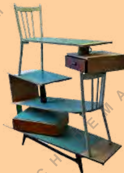
تصویر شماره ۲: استیپل کاست، طراح: تجورمی ورنه ونهوزن