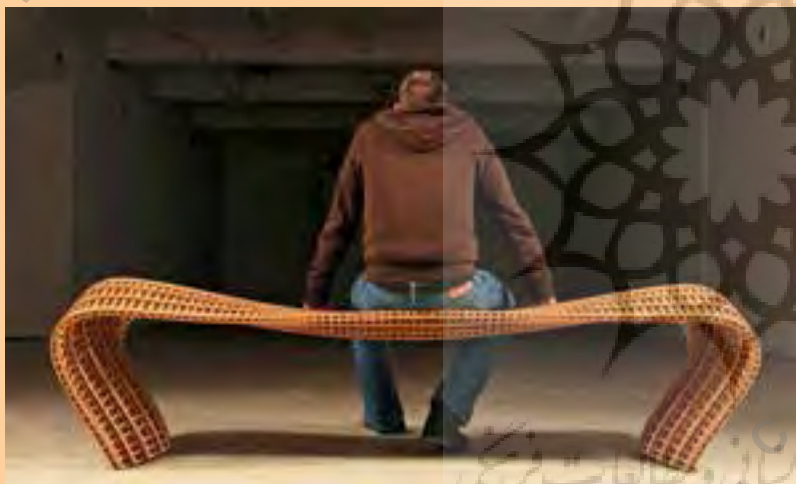
تصویر شماره ۴: طراح: ماتیس پلیسنینگ