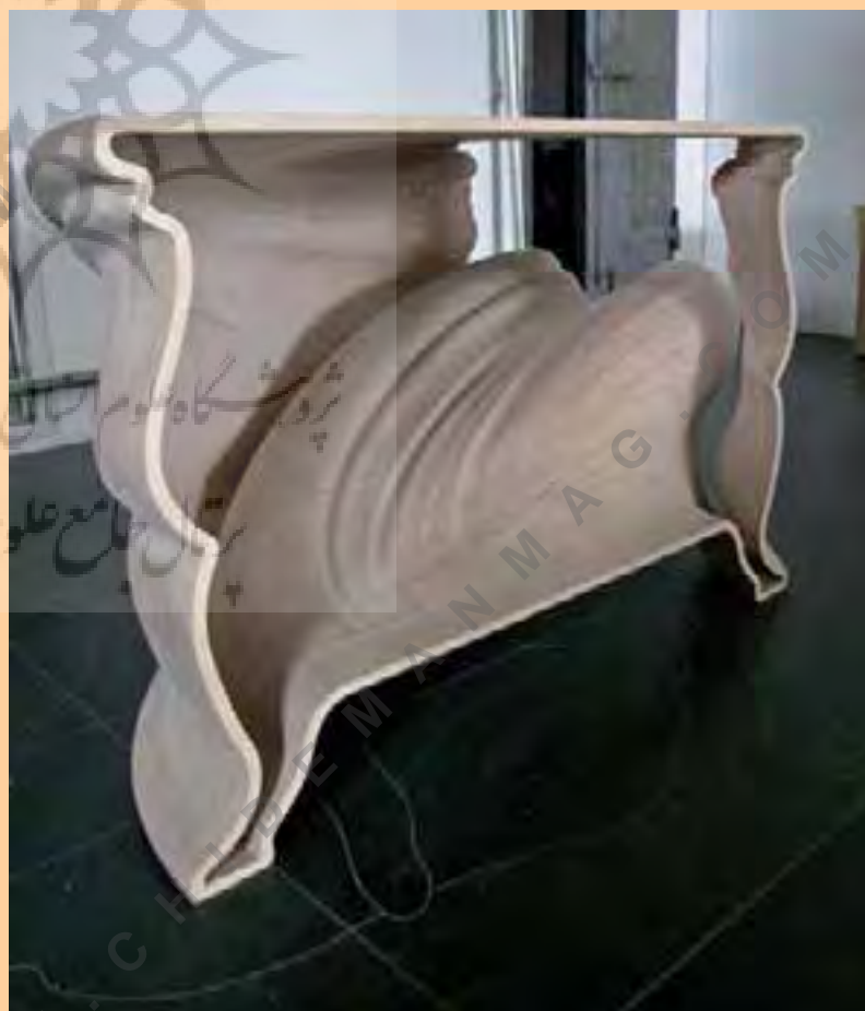
تصویر شماره ۱۰: میز سیندرلا، طراح: ژروئن ورهون در داماکروسوان، عکاس: هانس ون در مارس