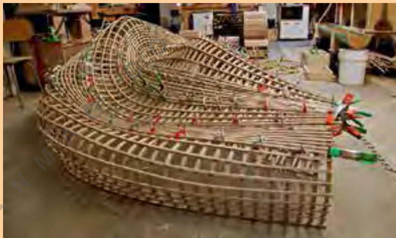
تصویر شماره ۵

این طرح از فاول‌ها الهام گرفته است که یک منطقه زاغه‌نشین پر جمعیت در برزیل است، که به صورت نوآورانه‌ای از مصالح شکسته و دور ریخته شده ساخته شده است. صندلی برادران کامپانا با یک رویکرد کنجکاوانه زاغه محله‌ای نوآوری پایین شهری ساخته شده است. این صندلی نیز از قطعات بسیار ریز چوب ساخته شده است که به صورت تصادفی و با دقت