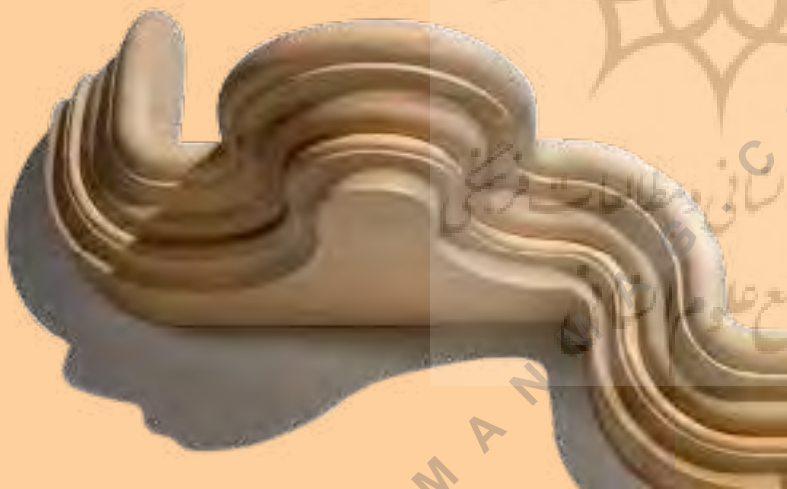
تصویر شماره ۹: طراح و عکاس: پائول لوباخ

جنبش هنر و پیشه در برابر شیوه های تولید کارخانه ای و صنعتی می ایستد و آنها را نفی میکند ، هر چند در بین آنها بودند مدعیانی که تشخیص دادند که استفاده بسیار اندک از ماشین آلات شاید بتواند بی تنوعی در محصولات را از بین ببرد. جنبش هنر و پیشه الهام گرفته شده از دست نوشت های منتقد هنری جان راسکین بود.