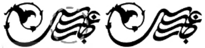
تصویر شماره ۱۰: نمونه نشانه نوشته وابسته به تکرار/موزه رضا عباسی/طراح: مرتضی ممیز