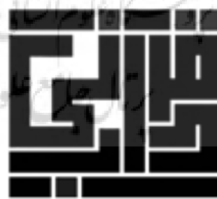
تصویر شماره ۲۲: نمونه نشانه نوشته بر اساس خط بنائی/طب قرآنی/طراح:سارا ارباب

بر اساس خط بنائی (تصاویر شماره ۲۱ و ۲۲):