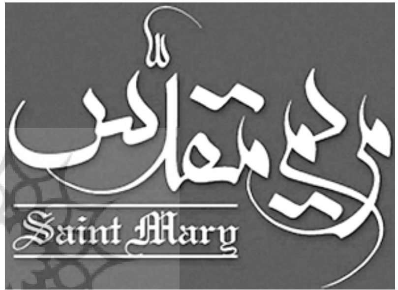
تصویر شماره ۲۰: نمونه نشانه نوشته بر اساس خط معلی/نشانه فیلم سینمایی مریم مقدس

بر اساس خط بنائی (تصاویر شماره ۲۱ و ۲۲):