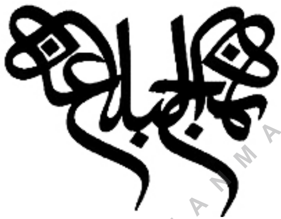
تصویر شماره ۱۴: نمونه نشانه نوشته وابسته به قرینگی/ نهج البلاغه/ طراح: محمد احصائی (همان منبع)

حذف می‌شود و در برخی دیگر، گوشه‌ای از حروف از نشانه حذف می‌شود (تصویر شماره ۱۶).