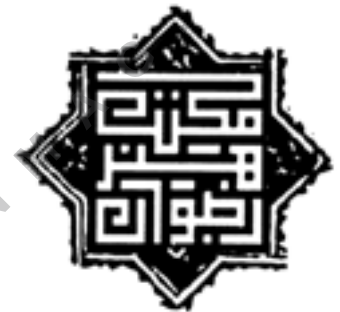
تصویر شماره ۲۱: نمونه نشانه نوشته بر اساس خط بنائی/مکتب هنر رضوان/طراح:سارا ارباب