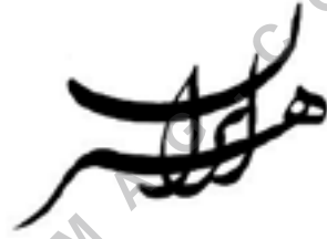
تصویر شماره ۱۹: نمونه نشانه نوشته بر اساس خط نستعلیق/هنر ایران/طراح:محمد احصائی

بر اساس خط نستعلیق (تصاویر شماره ۱۸ و ۱۹):