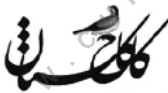
تصویر شماره ۹: نمونه نشانه نوشته‌های تلفیقی، شده/کاخ گلستان/طراح: مونا رحیم زاده (منبع تصویر: لوگو تایپ‌های ایرانی)