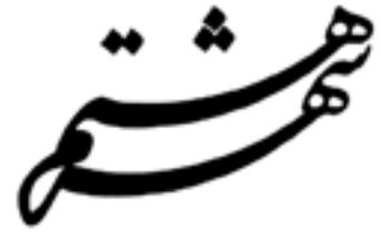
تصویر شماره ۱۸: نمونه نشانه نوشته بر اساس خط نستعلیق/شهر هاشم/طراح:شعیب ابوالحسنی