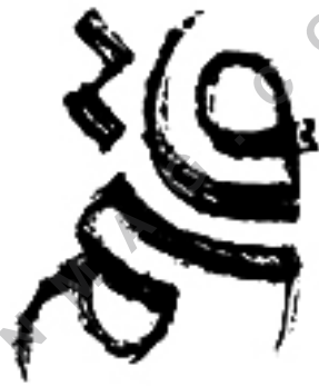
تصویر شماره ۷: نمونه نشانه نوشته‌های اتفاقی/قاسم/طراح: رضا بختیاری فرد