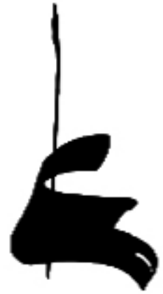
تصویر شماره ۶: نمونه نشانه نوشته‌های اتفاقی/علی/طراح: بابک صفری