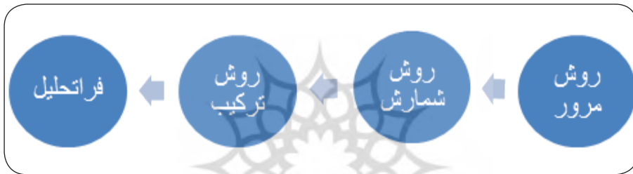
شکل شماره ۱: فرایند توسعه روش‌های مروری و ترکیب پژوهش‌ها (مهری، ۱۳۹۰: ۱۹).

داده‌های این تحقیق که از نوع توصیفی - تحلیلی و مروری ۱ است از طریق کتابخانه، اسناد، مجلات و اینترنت جمع‌آوری، مطالعه و بررسی شدند. برای جمع‌آوری داده‌ها و انتخاب جامعه آماری پژوهش‌های مرتبط، محققان به جستجوی مطالعات (منتشر شده و نشده) اعم از پایان‌نامه، مقاله، گزارش، طرح پژوهشی و ... از طریق سایت‌های خارجی و داخلی پرداختند. نتیجه جستجوی اولیه ۴۰ مورد بود که در نهایت، ۳۶ مورد مطالعه‌ای که پرسش‌های علمی سرراست و دقیق، مطرح و برای پاسخگویی به خودکشی از روش علمی صحیح، استفاده کرده بودند، به عنوان واحد تحلیل، جهت مطالعه انتخاب شدند و مطالعاتی که اطلاعات لازم را گزارش نکرده بودند و امکان محاسبه اندازه اثر آنها وجود نداشت از بین مطالعات حذف گردید.