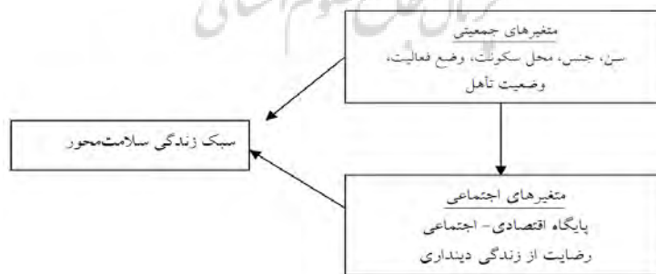
نمودار ۱. مدل مفهومی پژوهش