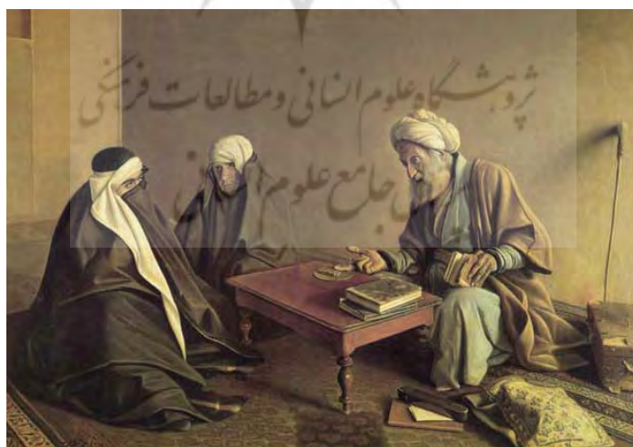
تصویر ۳. فالگیر، اثر کمال‌الملک (آرشیو وبسایت کاخ گلستان).