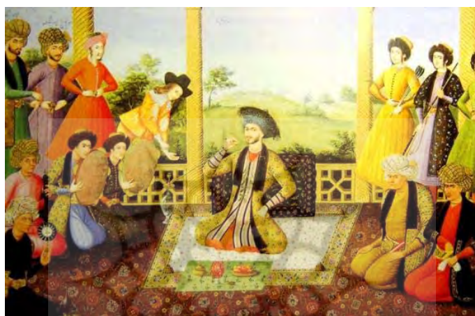
تصویر ۲. تصویری در یک مرقع (مرقوم علیقلی جبادار): شاه سلیمان، درباریان، و نوازندگان، ۱۶۶۴ م/ ۱۰۴۳ ش (پاکباز، ۱۳۸۸: ۱۳۹).

نگارنده این دوره جدید در تاریخ تصویرگری را، که در اواخر عصر قاجار و بعد از دوره مشروطه در عرصه فرهنگی و اجتماعی ایران رخ داد، نه در تقابل سنت و مدرنیته و نه در تقابل عناصر ایرانی و اروپایی و نه با نام‌ها و گرایش‌های اروپامحور و با مؤلفه‌های غربی هم‌چون «طبیعت‌گرایی» می‌داند بلکه در نظر دارد آن را گسست از «ملکوتی‌گری» و «دگرجهان‌خواهی» به سوی «ناسوتی‌گری» و «این‌جهان‌خواهی» بدانند و در چنین تقابلی تفسیر و معنا کند.