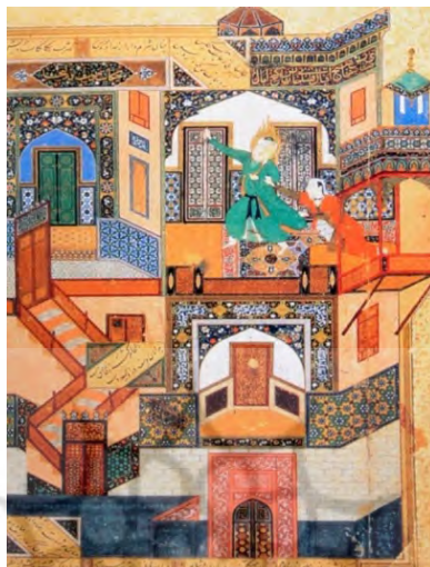
تصویر ۱. نگاره‌ای از بوستان سعدی (مرقوم کمال‌الدین بهزاد):

است در نظر گرفته می‌شدند. با توجه به عرفان شرقی و گره‌خوردگی آن با فلسفه اسلامی، که ایران نیز زادگاه و خاستگاه مهم آن تلقی می‌شود، فرض چنین نظامی بدیهی محسوب می‌شود. در ادامه اندکی به توضیح آن پرداخته خواهد شد (تصویر ۱). ۷