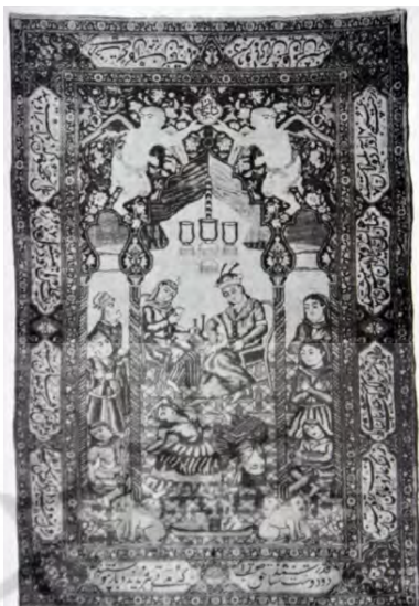
تصویر ۶. فرش با توده گره‌دار پشمی، با طرحی تصویری از خسرو و شیرین در حال تماشای رقصندگان، کاشان ۱۸۵۳ م / ۱۳۳۱ ش (اوری، ۱۳۸۸: ۶۸۲).

عکاسی، عکس‌های اروپایی، و کارت‌پستال‌هایی است که به نظام تصویری آن دوران راه یافته بودند و مسیر تسلط را می‌پیمودند. این نمونه‌ها، که مبین نگاه دنیوی و این‌جهانی و رو به پایین‌اند، نمودی دیگر از تحول و چرخش در فرهنگ و هنر ایران محسوب می‌شوند.