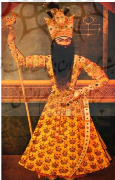
تصویر ۴. فتحعلی‌شاه در لباس رسمی (مرقوم مهرعلی)، ۱۸۱۳ م / ۱۱۹۲ ش (پاکباز، ۱۳۸۸: ۱۷۹).

اگرچه در همین نظام «این جهان خواهی» و «این جهان بینی» نیز با نوع دیگری از نظام مشابهت‌ها، آن هم از نوع «هم‌سانی» (similitude)، روبه‌رو هستیم چراکه هنوز زبان در پیوند با پدیده‌ها و اشیا است ولی امور و پدیده‌ها پیوند خود با عالم مثال را به طور کامل قطع می‌کنند و «این جهانی» می‌گردند. به عبارت دیگر، جهان خاکی همان‌گونه که هست دیده می‌شود، خواستنی و پذیرفتنی می‌گردد، و ابژه نگاه انسان می‌شود. عکاسی، به مثابه نوعی فناوری تصویری در عرصه دیدن و نگاه، بنا بر واقع‌گرایی‌اش نقش بسزایی در این جهت‌گیری داشته است. با آمدن عکاسی دیگر تصویرگر در موضعی بالادست نیست و از بالا نمی‌نگرد و هر آنچه مخاطب در تصویر حاصل از عکاسی می‌بیند دیگر صورت مثالی ندارد، بلکه عین «واقعیت» است و در پیش چشمش موجود. نظام مشابهت، مبنی بر تأسی، فقط بر محور شاه است که باقی می‌ماند، چرا که هنوز شاه، مثلاً فتحعلی شاه، نه بدان صورت که دیده می‌شود بلکه بدان صورت که باید پنداشته شود، یعنی شخصی که حکومت از جانب خدا به او تفویض شده است و حق مالکیت از جانب خدا بر بندگان و مملکت خویش را دارد، نقاشی می‌شود و این پنداری است که نه فقط نقاش بلکه هر کسی باید نسبت به شخص شاه داشته باشد؛ این نگاهی است که همگانی شده و عمومیت می‌یابد (تصویر ۴).