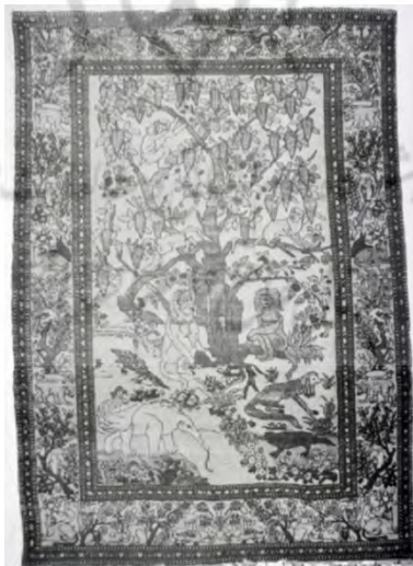
تصویر ۷. فرش در طرحی از یک درخت سستی از گل که حیوانات در آن آشیانه دارند. کاشان اواخر قرن ۱۹ (اوری، ۱۳۸۸: ۶۸۳).