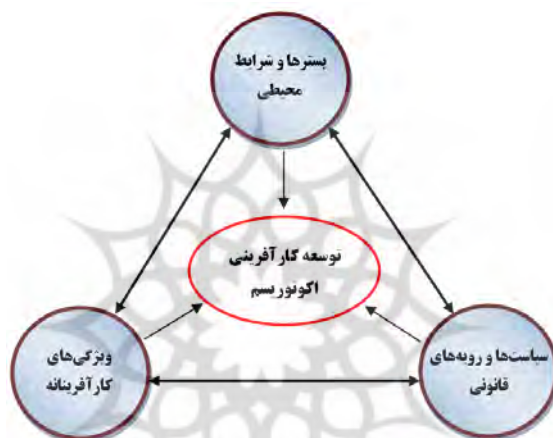
شکل ۱. مدل مفهومی تجربی الگوی توسعه کارآفرینی اکوتوریستی

مسئله مهم در رابطه با توسعه کارآفرینی اکوتوریستی، شناسایی عوامل مؤثر در توسعه کارآفرینی اکوتوریستی است که از طریق مطالعه توسعه کارآفرینی و اجزا و عناصر آن - که در چارچوب نظری اشاره شد - می‌توان الگوی مطلوب برای توسعه کارآفرینی اکوتوریستی را بر اساس موارد ذکر شده در قالب شکل ۱ ارائه کرد.