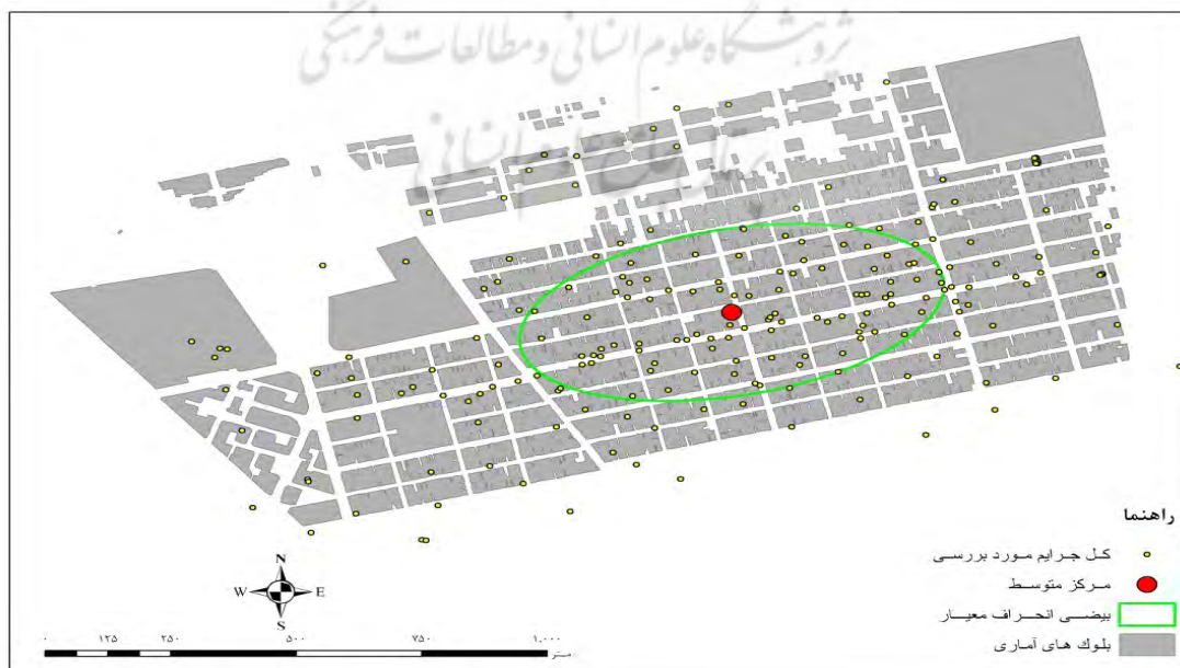
شکل ۱. نقشه‌ی مرکز متوسط و بیضی انحراف معیار جرایم ارتكابی در منطقه اسکان غیر رسمی اسلام‌آباد