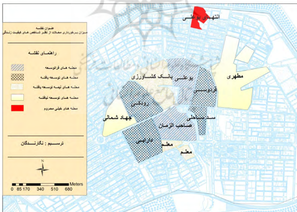
شکل ۲. نقشه سطح‌بندی محلّه‌های بافت فرسوده شهر کوهدشت در عامل‌های تلفیقی