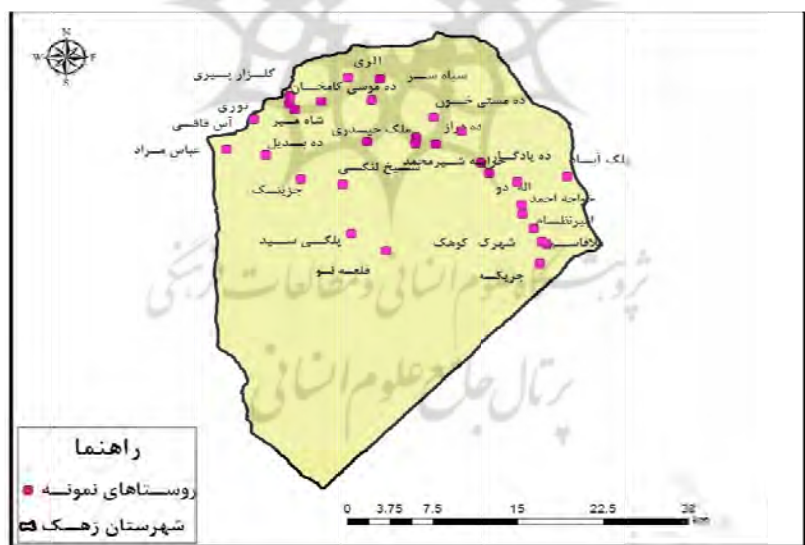
شکل ۲. موقعیت و پراکندگی روستاهای مورد مطالعه (شهرستان زهک)