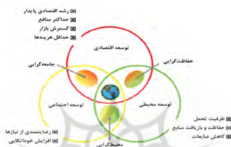
شکل ۱. ابعاد سه‌گانه پایداری

محیط‌زیست و مداخله‌گری عقلانی به‌منظور بهبود این روابط، به‌کارگیری تلفیقی تکنولوژی جدید، دانش بومی و تأکید بر حقوق آحاد بشر (آزیری، ۱۳۸۷، ۳). توسعه پایدار سه بعد اقتصادی، اجتماعی و محیطی را دربرمی‌گیرد، که دارای ساختاری مشخص و نظامی سلسله‌مراتبی هستند (شکل ۱).