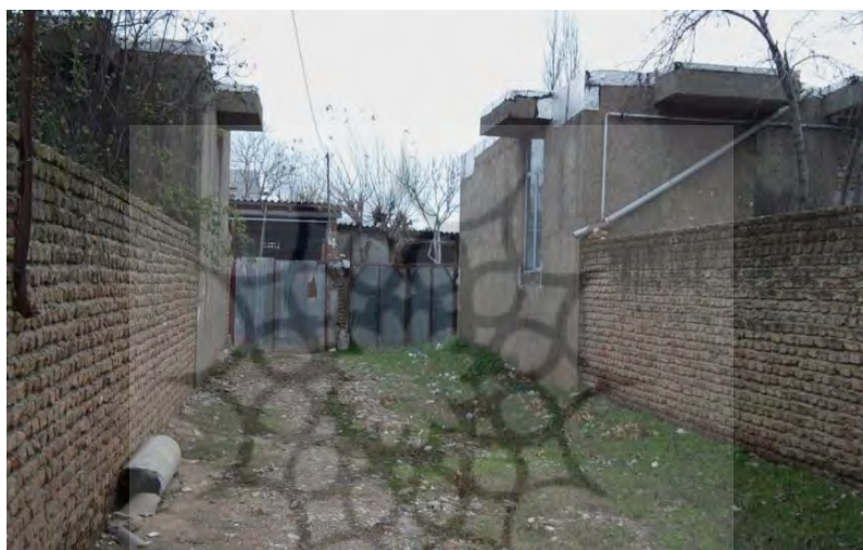
شکل ۲. نمایی از خانه‌ها و آغل‌های واگذارشده به مهاجران

نمونه‌گیری پژوهش حاضر از مفاهیم صورت گرفته است و نه از افراد. تحقیق پیش رو، حاصل تحلیل ۲۶ مصاحبه با روستانشینان (۱۲ مصاحبه در مرحله اول و ۱۴ مصاحبه در مرحله دوم) و ۹ مصاحبه با مسئولان اجرایی ذی‌ربط (فرمانداری، اداره منابع طبیعی و سازمان جهاد کشاورزی) است که مطابق توضیح، کدگذاری و مفهوم‌یابی شده‌اند.