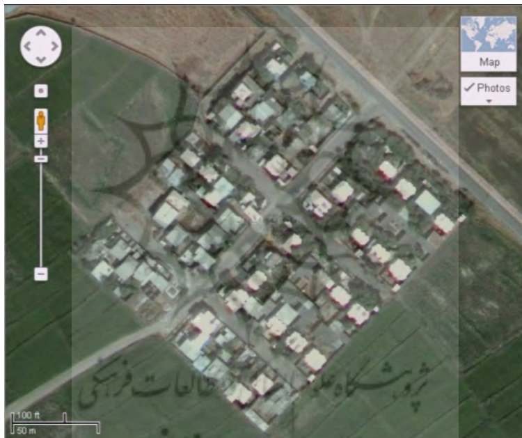
شکل ۱. عکس هوایی از شهرک منابع طبیعی

شکل ۱ مشخص است این محله -که شامل یک خیابان اصلی و دو چهارراه کوچک است- در واقع شهرک نیست، بلکه کوچه یا محله‌ای کوچک به ابعاد تقریبی 150 \times 170 متر است. ولی چون نام رسمی ندارد و ساکنان محلی آن را «شهرک منابع طبیعی» یا «محله کوهساری‌ها» (به معنای کوه‌نشینان) می‌خوانند، از این نام استفاده شده است که در ادامه به اختصار «شهرک» ذکر می‌شود. اکنون در شهرک منابع طبیعی تقریباً ۴۰ خانوار کوهساری و ۱۰ خانوار مهاجر سیستانی زندگی می‌کنند.