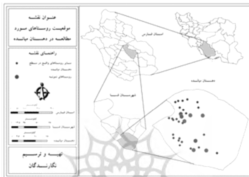
شکل ۱. نقشه موقعیت فضایی روستای مورد مطالعه در سطح دهستان میانده