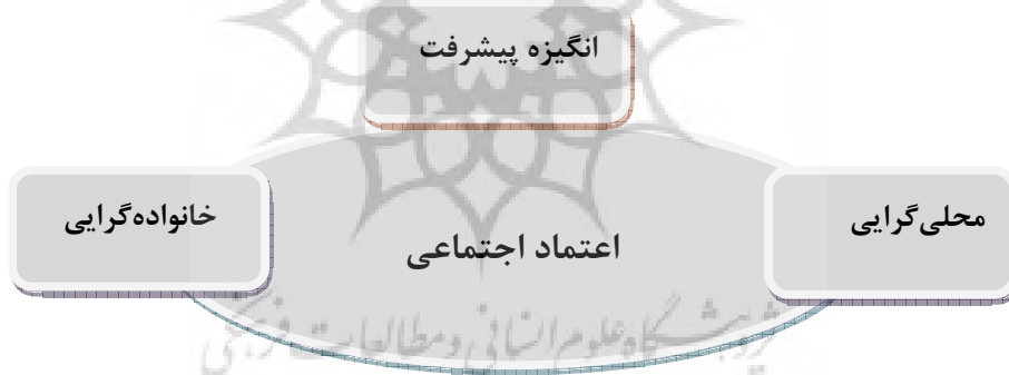
شکل ۱. خرده‌فرهنگ محلی

در پیش‌بینی و تبیین رفتار انسان به آن توجه شود (Elliot, 1997). به گفته رابینز ۱ (۱۹۹۳)، انگیزه پیشرفت در واقع گرایشی است برای پیشی گرفتن بر دیگران به منظور دستیابی به تعالی با توجه به ملاک‌های مشخص. نخستین شکل‌بندی روشن از انگیزه پیشرفت را مورای در سال ۱۹۸۳ انجام داد. وی انگیزه پیشرفت را میل یا گرایش به از میان برداشتن یا غلبه بر موانع و به کار گرفتن نیرو و تلاش برای انجام خوب و سریع امور دشوار تعریف کرده است. ناگفته نماند که مک سلند به شرح و بسط همین مفهوم پرداخت و امروزه انگیزه پیشرفت با نام وی همراه است. متغیر انگیزه پیشرفت تمایل به رقابت براساس یک استاندارد و واکنش‌های هیجانی فرد در موقعیت‌هایی است که این هیجان‌ها در مقابل هم قرار می‌گیرند و می‌توان عملکردشان را ارزیابی کرد (Robbins, 1993).