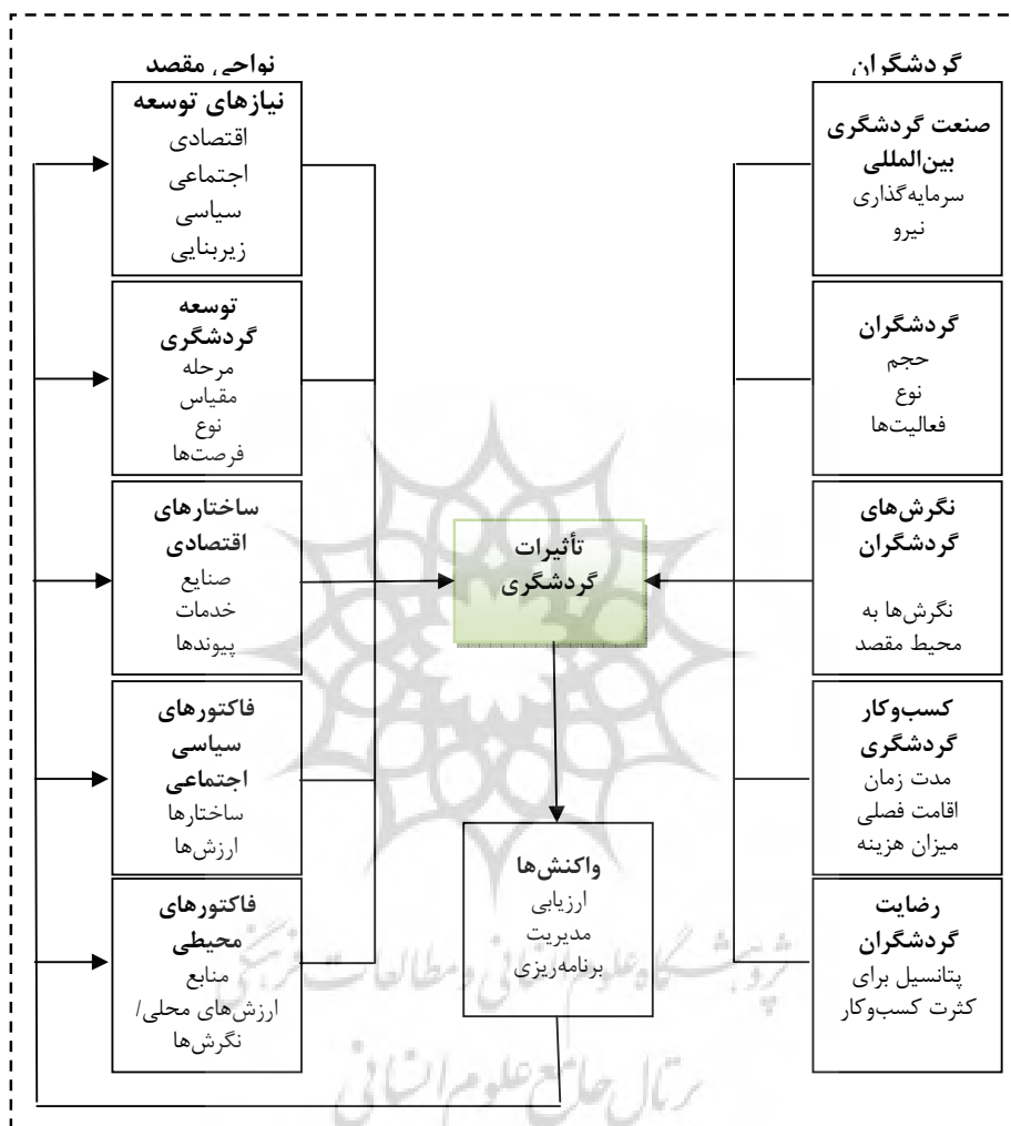
شکل ۱. چارچوبی برای تجزیه و تحلیل اثرات گردشگری