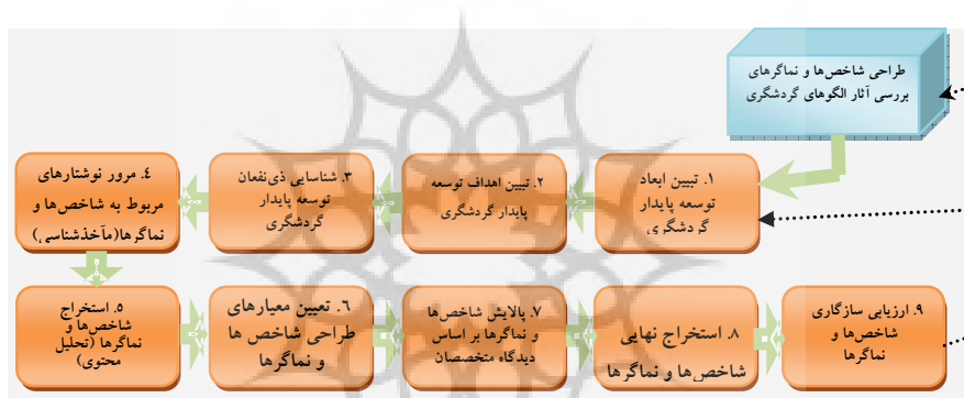
شکل ۴. فرآیند تبیین شاخص‌ها و نماگرهای توسعه پایدار

قابلیت مقایسه در طول زمان و مکان) به وسیله ۳۵ نفر از متخصصان با روش دلفی در دو مرحله مورد بررسی قرار گرفت؛ و در نهایت طی فرایند ۹ مرحله‌ای، ۲۶ نماگر در قالب ۴ شاخص عمده با روایی ۰/۷۹۳ مورد تأیید قرار گرفت ۱ (شکل ۴). همچنین سنجش پایایی پرسشنامه با بهره‌مندی از روش آلفای کرونباخ و روایی آن با روش تحلیل عاملی انجام شد که ضریب کل آلفا برابر ۰/۷۳۱ و مقدار K.M.O برابر ۰/۸۱۲ به دست آمد. همچنین به منظور تجزیه و تحلیل داده‌ها از نرم‌افزار SPSS (آمار توصیفی و استنباطی) استفاده شده است.