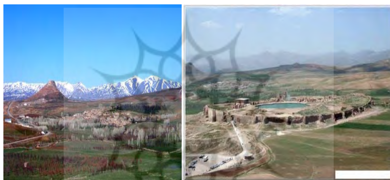
شکل ۱: نمایی از تخت سلیمان شکل ۲: زندان سلیمان