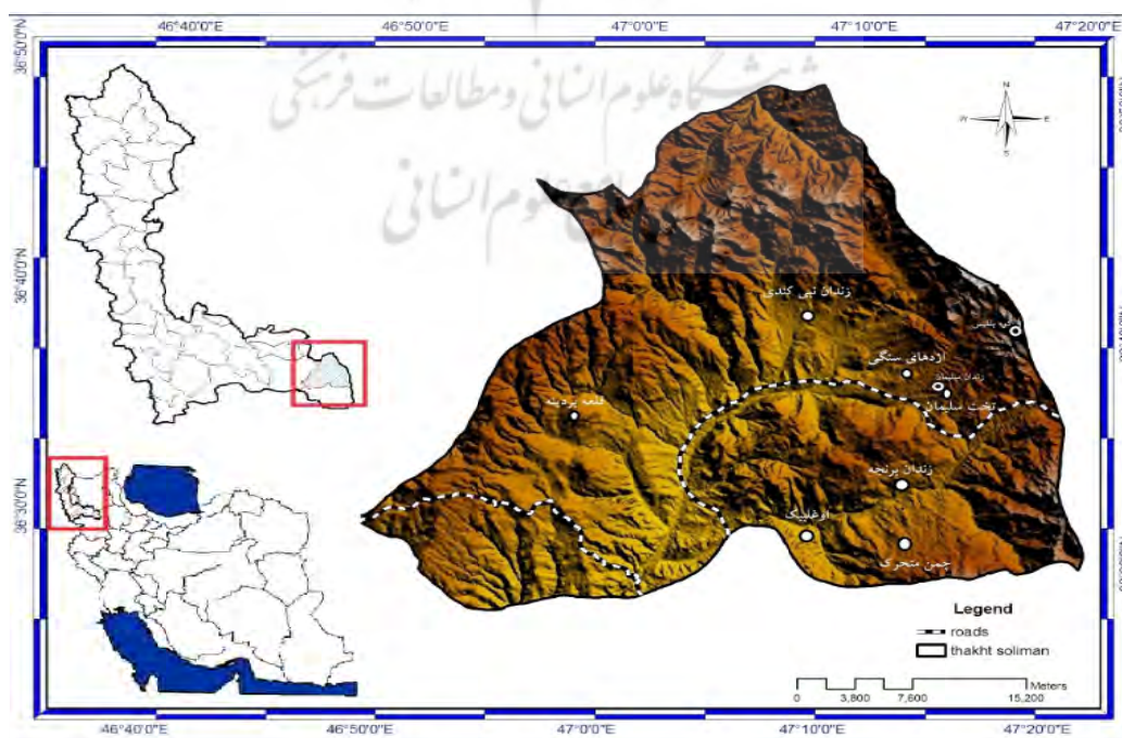
نقشه شماره ۲: موقعیت ژئومورفوسایت های منطقه

در این منطقه، منظر فرهنگی در گستره ای از زمان و مکان شکل گرفته است که در این روند، بستر طبیعی نقش مهمی بازی می کرده است و بیشتر ساخت و سازهای انسانی موجود در بستر طبیعت، تحت تاثیر فرایندها و فراگردهای ویژه تکامل جوامع بشری و رویدادهای طبیعی و رخدادهای تاریخی قرار گرفته (بهبهانی و همکاران، ۱۳۸۹: ۱۱۳) و مناظر فرهنگی را خلق کرده است که بر جذابیت های گردشگری این منطقه افزوده است. از آنجاییکه ژئومورفوسایت های منطقه در برخی ویژگیها از جمله شکل و فرایند شکل گیری مشابه بوده است، از هر نوع تنها یک نمونه انتخاب شده است. از طرفی به گونه ای انتخاب شده است که پراکندگی جغرافیایی مناسب داشته باشد. این کار از طریق مطالعات کتابخانه ای و همچنین بررسی های میدانی در منطقه صورت گرفت. در نهایت ۹ ژئومورفوسایت جهت ارزیابی (نقشه شماره ۲) انتخاب شدند: که شامل، تخت سلیمان (شکل ۱)، زندان سلیمان (شکل ۲)، کوه بلقیس، اژدهای سنگی، زندان نبی کندی، چمن متحرک یا چملی گل (شکل ۴)، زندان برنجه (شکل ۵)، قلعه بردینه، یخچال اغول بیگ.