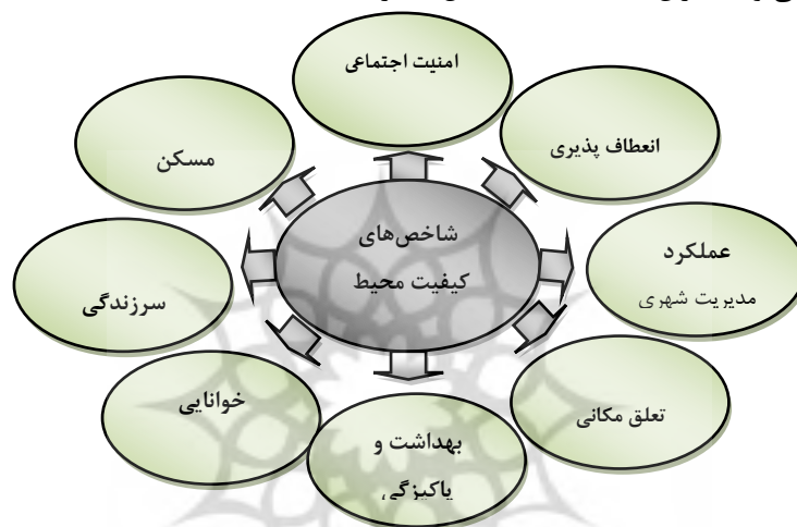
شکل ۱- شاخص‌های کیفیت محیط - منبع: Van Kamp and et al, 2003 & Crap and et al, 1976

داده شود (Tibbalds, 1992). مطالعه سیستماتیک در مورد کیفیت محیط شهری محدود به نیمه دوم قرن بیستم می‌شود. اف.ام. کارپ و همکارانش مطالعات انجام شده در زمینه کیفیت محیط را به دو دسته تقسیم کرده‌اند (Crap et al, 1976:241)؛ دسته اول شامل مطالعات اولیه‌ای هستند که به طور جنبی با موضوع کیفیت محیط مرتبطند و دسته دوم از تحقیقات انجام شده نیز بر روی خصوصیات افراد ساکن در یک محله متمرکز شده است. به طور کلی تحقیقات در زمینه‌ی کیفیت محیط شهری نخست از کیفیت مسکن و رضایت از محیط سکونتی شروع شده و به تدریج به مقیاس‌های وسیع‌تر در سطح محلات، شهر، منطقه و کشور کشیده شده است (Van Kamp et al, 2003:6). مجموع عواملی که برای سنجش کیفیت محیط مد نظر قرار می‌گیرند روی هم رفته نیم‌رخ کیفیت محیطی حوزه‌ی مورد مطالعه را به وجود می‌آورند. نیم رخ یک نمای سریع و آسان از شرایط محیط بر حسب عواملی محیطی مرتبط فراهم می‌آورد (Van poll, 1997:5). از مباحث مطرح شده در رابطه با مؤلفه‌های سازنده‌ی کیفیت محیط چنین نتیجه گرفته می‌شود که مبحث کیفیت محیط یک مفهوم چند بعدی و سلسله مراتبی است (بحرینی و همکاران، ۱۳۷۷: ۴۳). (شکل شماره ۱).