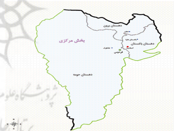
شکل ۱- نقشه جغرافیایی شهرستان فردوس

با توجه به جدول (۱) مشاهده می‌شود که بیشترین تمرکز کشت زعفران در شهرستان‌های استان خراسان جنوبی مربوط به شهرستان فردوس می‌باشد. لذا در این مطالعه با توجه به شاخص‌های محاسبه‌شده در جدول (۱) شهرستان فردوس به‌عنوان نمونه مورد مطالعه در نظر گرفته شد.