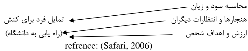
جدول ۱- رابطه بین متغیر و نظریه منتخب