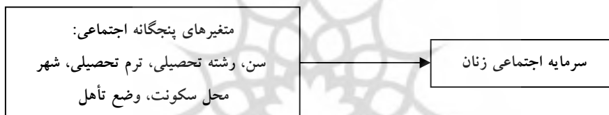
نمودار ۲: الگوی پژوهش

این تحقیق در مطالعه سرمایه اجتماعی زنان سعی می کند در باید متغیرهای اجتماعی در سرمایه اجتماعی زنان دانشگاه پیام نور چه تأثیری داشته است؟ بر این اساس در الگوی تحلیلی این تحقیق، سرمایه اجتماعی زنان به عنوان متغیر ملاک و عوامل پنجگانه اجتماعی به عنوان متغیر پیش بین در نظر گرفته شده است.