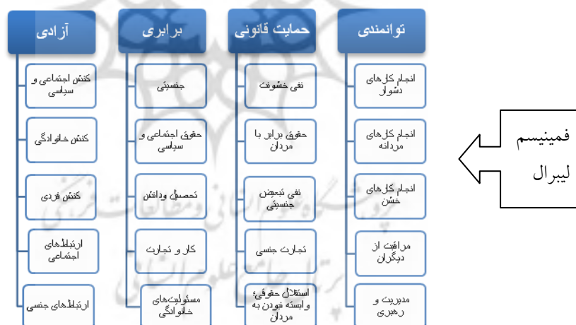
شکل شماره ۱- ابعاد و مؤلفه‌های فمینیسم لیبرال

تلاش برای افزایش حق نظردهی و انتخابات برای زنان، با محدودیت‌هایی که برای زنان وجود دارد در تقابل است. نظام مردسالاری زنان را در استفاده از این حق در تنگنا قرار می‌دهد. برای مثال، زنان وقت کافی ندارند تا در مباحث سیاسی مشارکت کنند. برخی از الگوهای مردانه، زنان را دارای استعداد لازم برای رهبری نمی‌دانند.» (دانشنامه استنفورد، ۲۰۱۳: ۲۳). دانشنامه استنفورد می‌افزاید، برای رهایی از حلقه تنگ فرهنگ مردسالاری، «باید تغییرات فرهنگی ایجاد شود و الگوهایی که توانایی زنان را برای مشارکت در امور سیاسی کافی نمی‌دانند، تغییر یابند. این کار برای تثبیت حقوق زنان و ارزش‌های دمکراسی و پایان دادن به سلطه مردان لازم است.» (دانشنامه فلسفی استنفورد، ۲۰۱۳: ۲۴).