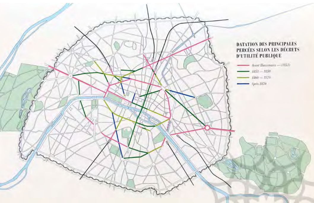
تصویر ۲ Pic2