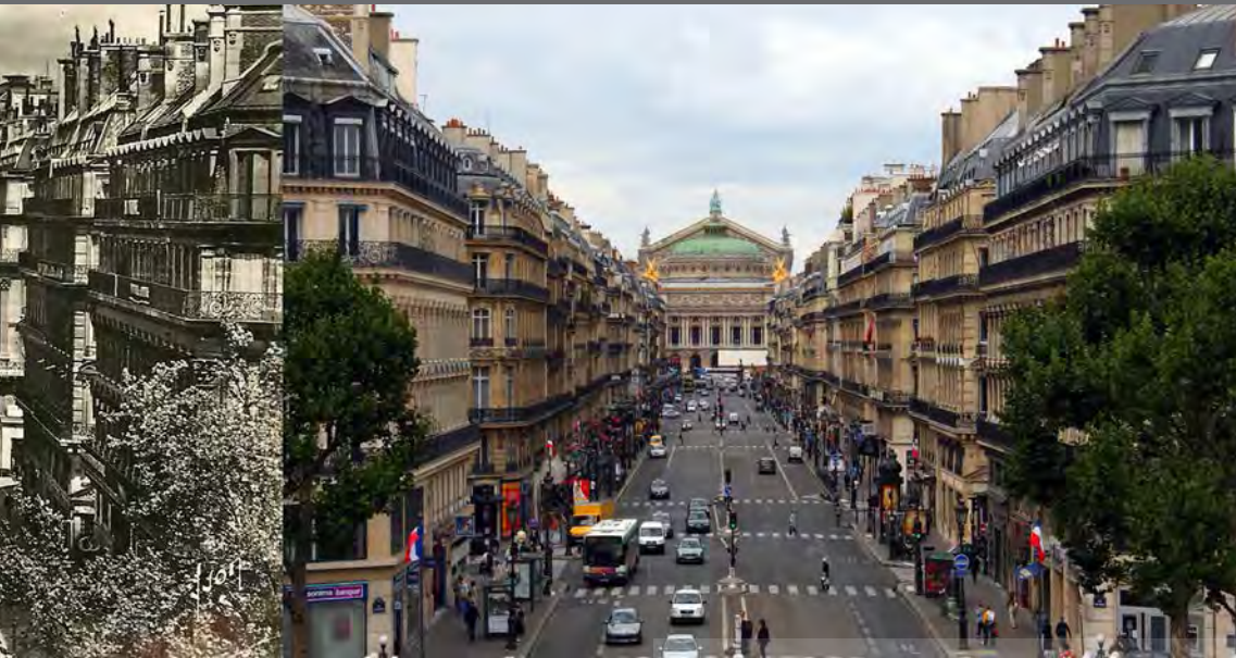
تصویری: خیابان اپرا، اواسط قرن بیستم (سمت چپ) و اوایل قرن بیستم و یکم (سمت راست).