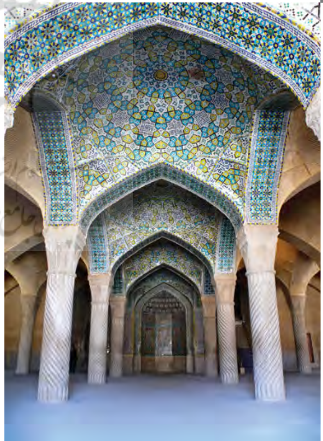
تصویر ۴ Pic4

کاربرد سنجیده رنگ، نظم‌آفرین است و در این انتظام و هماهنگی است که رنگ‌ها چهره واقعی خود را نمایش می‌دهند و اعجاز می‌کنند. رنگ‌ها می‌توانند نمادها و نشانه‌هایی از زندگی، نوع تفکر و اعتقادات انسان‌ها و جوامع باشند. رنگ پدیده‌ای منظرین و عینی-ذهنی است و تداعی‌گر معنا و مفهوم خاص است. در برندسازی نیز نقش رنگ‌ها زمانی مؤثر است که با هویت مطلوب یک برند تطابق داشته و نسبت به رقبا قابل تمایز باشد. بدون در نظر داشتن چنین مفهومی، ترجیح دادن یک رنگ به رنگ دیگر معنا ندارد. برای انتخاب رنگ برند نمی‌توان صرفاً به مجموعه قواعد کلیشه‌ای و معینی که در معانی