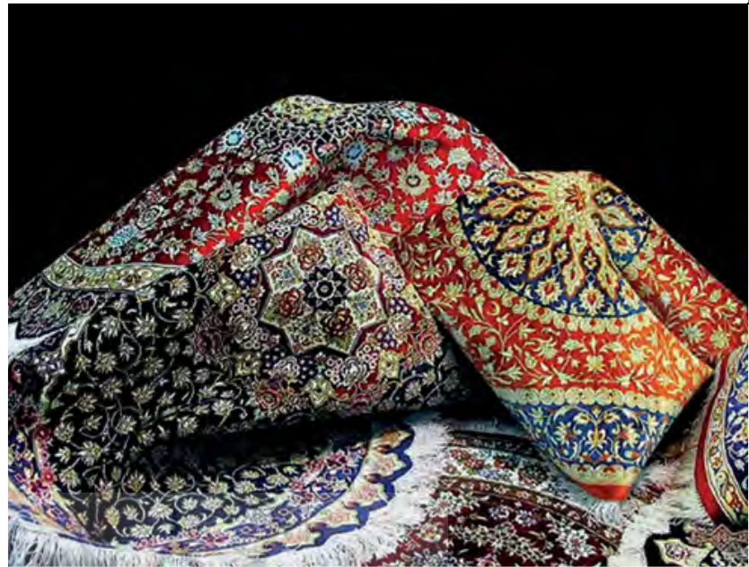
تصویر ۲. فرش ایرانی که تجلی مفهوم هفت رنگ است.