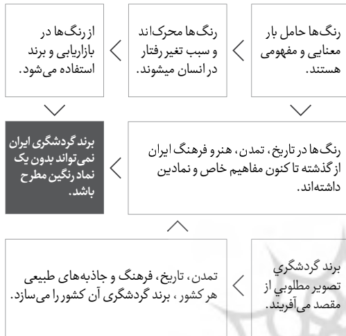
Diagram 1. The conceptual model of research, Source: Author.

رنگ‌ها نهفته است، اکتفا کرد، بلکه باید به نقش آن رنگ در تصویری که به عنوان یک برند در برانگیختن افراد دارد، توجهی خاص داشت.