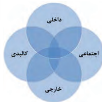
Diagram 1. Renovation Framework. Source: Author.

جدول ۱. شش دوگانه اساسی ۱، مأخذ: نگارنده.