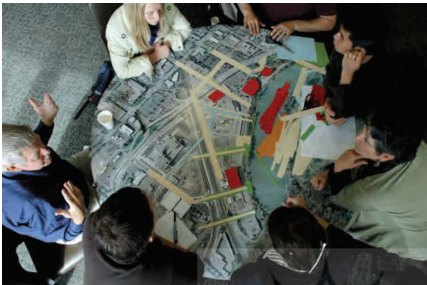
تصویر ۲ Pic2

تصویر ۲: در برنامه ریزی های اجتماعی نوسازی برای در نظر گرفتن جنبه هایی چون حس تعلق در محله لازم است از تجربیات برنامه ریزان و مددکاران اجتماعی استفاده شود.