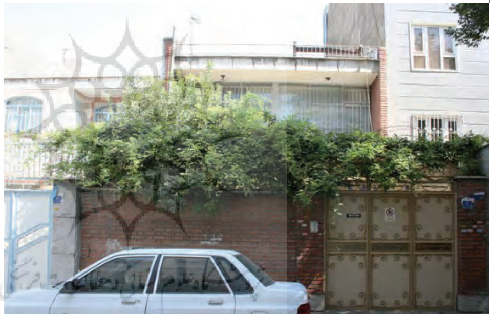
تصویر ۴ Pic4

تصویر ۴: سبزی‌نگی در جداره کوچه‌ها از شاخصه‌های منطقه ۱۷ است که به دلیل نبود ضوابط یا مشوق‌هایی برای حفظ آن، از بخش‌های نوساز منطقه حذف شده است، مأخذ: مهندسین مشاور پژوهشکده نظر، ۱۳۹۲.