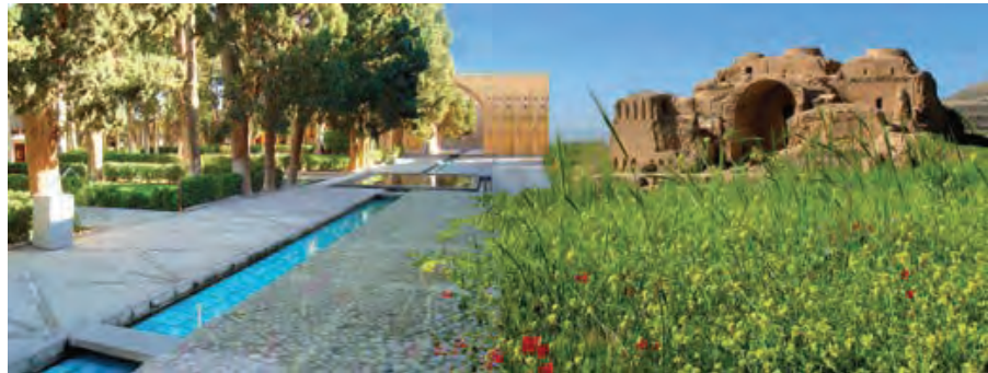
تصویر ۳: ترکیبی خیالی از تداوم نشانه‌های به جا مانده از تصویر باغ سیاوش که عناصر یاد شده در داستان سیاوش را، کوشک، باغ، ایوان، جوی آب، باغ، بوستان و گل، جلوه‌گر می‌کند.

Pic3: Imaginative combination of the continuing signs left from the picture of Siavash garden story reveals the elements of this story by belvedere, garden, fortification, water, flower gardens and flowers.