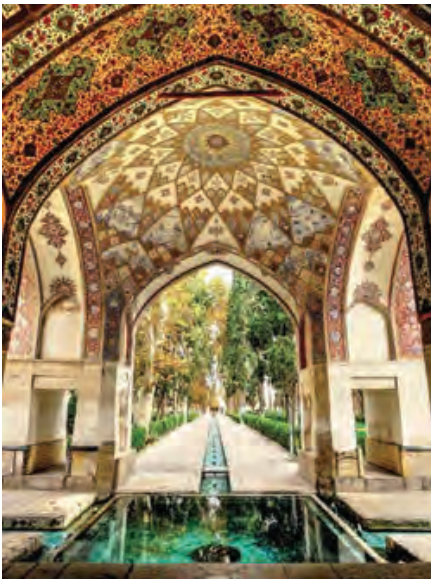
تصویر ۱: کوشک ورودی باغ فین کاشان را می‌توان شارسان دانست، یعنی جایی که چهارسوی آن بوستان‌ها باشد، مأخذ: www.panoramio.com

Pic 1: The entrance belvedere in Fin Garden of Kashan can be considered as Sharsan, where the garden is surrounded by gardens in the four directions. Source: www.panoramio.com