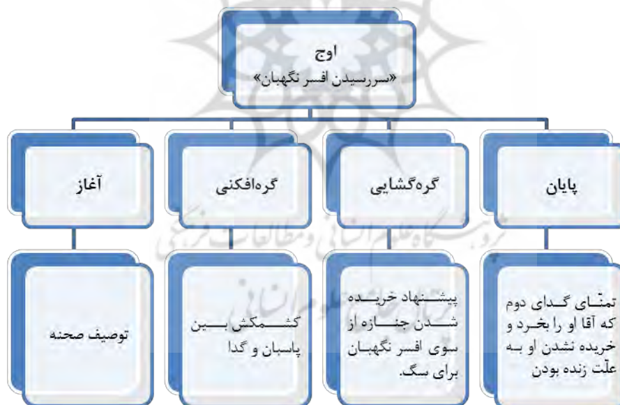
نمودار (۲) نمایشنامه جنازه‌ای بر پیاده‌رو

همان‌گونه که از تحلیل پیرنگ دو اثر برمی‌آید، پیرنگ‌ها شباهت زیادی با هم دارند و کنش‌ها در آن مشابه است و بر روی الگوی فرایتاگ، در نقاط مشابهی قرار گرفته‌اند، با این