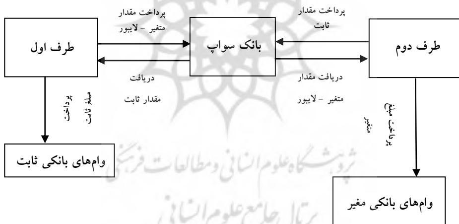
شکل ۱. نمایش‌دهنده مدل ساده‌ای از سواب نرخ بهره است:

متحده با سررسید یکسان است، می‌باشد (California debt and investment advisory commission, 2007, p.2) برای درک بهتر این قرارداد، می‌توان این مثال را طرح کرد: فرض کنید که برای ۵ سال آینده طرف اول توافق می‌کند تا به دیگری نرخ ثابت ۶٪ به‌طور سالانه بپردازد، درحالی‌که طرف دوم توافق می‌کند تا لایبور سه‌ماهه را پرداخت نماید. طرف اول پرداخت‌کننده ثابت و طرف دوم دریافت‌کننده ثابت خواهد بود. فرض کنید که اصل سرمایه فرضی ۱۰۰ میلیون دلار بوده و پرداخت‌ها هر سه ماه به مدت ۵ سال مبادله می‌شوند. این بدین معناست که هر ۳ ماه طرف اول به طرف دوم ۱/۵ میلیون دلار (۱۰۰ × ۰.۰۶ / ۴) می‌پردازد. میزانی که طرف دوم به طرف اول پرداخت خواهد نمود، ۱۰۰ میلیون دلار ضرب در لایبور سه‌ماهه تقسیم بر ۴ خواهد بود (Gerald W. Buetow, Frank J. Fabozzi, 2001, p.7)