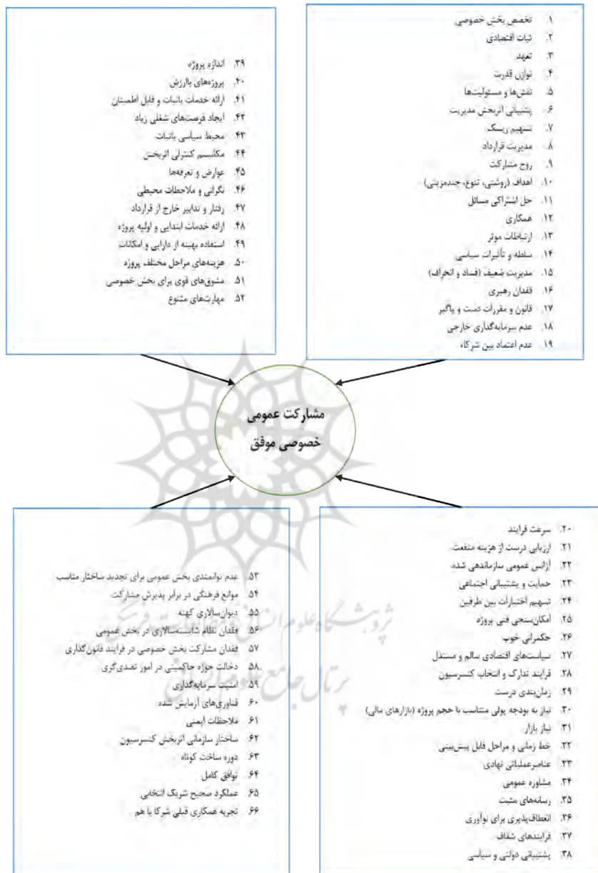
شکل ۳: مدل مفهومی پژوهش