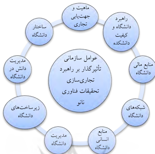
شکل ۲. چارچوب مفهومی عوامل سازمانی تأثیرگذار بر انتخاب راهبرد تجاری سازی تحقیقات فناوری نانو (محقق ساخته، ۱۳۹۳)

بعضی از عوامل سازمانی شناسایی شده در این تحقیق در پژوهش محققان دیگر مشاهده نمی شود. برای مثال منابع انسانی دانشگاه (مانند وجود نیروی انسانی خبره در حوزه فناوری نانو اعم از اعضای هیئت علمی و دانشجویان تحصیلات تکمیلی)، راهبرد دانشگاه (مانند راهبرد تجاری سازی و توسعه محصول) و شبکه های دانشگاه (مانند نفوذ و ارتباط دانشگاه در مراکز صنعتی و تصمیم گیری) که در این تحقیق به عنوان ابعادی از عوامل سازمانی مؤثر بر انتخاب راهبرد تجاری سازی تحقیقات دانشگاهی فناوری نانو شناسایی شده است، در یافته های محققان دیگر بیان نشده است. از آنجا که فناوری نانو یک فناوری نوظهور است، لذا تعداد کمی از متخصصان دانشگاهی در این حوزه تخصص دارند. بنابراین، وجود نیروی انسانی خبره مانند اعضای هیئت علمی و دانشجویان تحصیلات تکمیلی متخصص در فناوری نانو، عاملی مهم در انتخاب راهبرد تجاری سازی تحقیقات دانشگاهی در این حوزه محسوب می شود. همچنین، رویکرد سنتی آموزش صرف و تولید دانش بی توجه به ابعاد تجاری سازی آن، موجب ایجاد دغدغه و نگرانی محققانی است که به تجاری سازی یافته های تحقیقاتشان تمایل دارند. لذا وجود راهبرد تجاری سازی تحقیقات دانشگاهی در دانشگاه مخصوصاً درباره فناوری های پیشرفته و نوظهور، بر